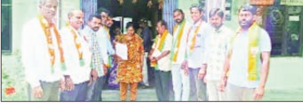
మునగాల , మార్చి 17, ప్రభాతవార్త