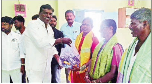
నార్కట్ పల్లి ప్రభాతవార్త మార్చి 17 పరిశుభ్ర గ్రామం కోసం - పారిశుధ్య

స్వచ్ఛ గ్రామం - కార్మికుల కృషికి కృతజ్ఞతలు