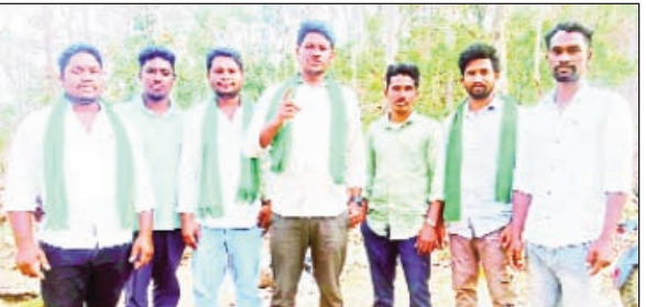
వెంకటాపురం అర్జన్ ప్రభాతవార్త: ఏజెన్సీ ప్రాంతాల్లో ఇసుక ఢి సెల్లింగ్ వ్యవస్థ రద్దు చేయాలని గొండ్వానా సంక్షేమ పరిషత్ జిల్లా అధ్యక్షుడు