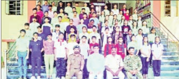
నర్ధంపేట, మార్చి 17, ప్రభాతవార్త

బాలాజీ టెక్స్టిల్స్ సిబిఎస్ఈలో ఎన్.సి.సి విద్యార్థుల ఎంపిక