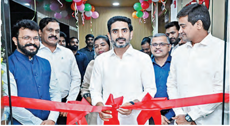
మంగళవారం ఎంఐడిబి నూతన కార్యాలయాన్ని ప్రారంభిస్తున్న మంత్రి లోకేశ్, చిత్రంలో మంత్రి కొండపల్లి శ్రీనివాస్