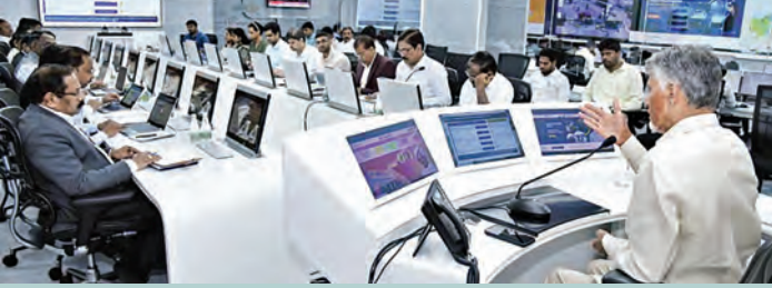
మంగళవారం గ్యాస్ సరఫరాపై అధికారులతో సమీక్షిస్తున్న సీఎం చంద్రబాబు నాయుడు

హాస్టళ్లు, ఆసుపత్రులు, ఆలయాలకు పూర్తి సరఫరా అర్బీజిఎస్ నుంచి గ్యాస్ లభ్యతపై సీఎం చంద్రబాబు సమీక్ష