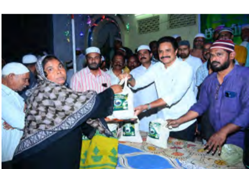
కార్యక్రమంలో ముస్లిం సోదరులతో పాటు కూటుమి నాయకులు, కార్యకర్తలు పాల్గొన్నారు.

హేయంతో హైదరాబాదులో మక్కా భవనం నిర్మించి ప్రస్తుతం గుంటూరులో నూతనంగా మక్కా భవనం నిర్మించారని గుర్తు చేశారు. మక్కా వెళ్లే ముస్లిం సోదరులకు రూ. లక్ష ఆర్థిక సాయం చేస్తున్నట్లు చెప్పారు. తణుకు నియోజకవర్గంలో ప్రతి ఏటా అందిస్తున్నట్లుగానే దాదాపు 1700 కుటుంబాలకు రంజాన్ తోఫాను ఈ ఏడాది కూడా అందించడానికి ప్రణాళికలు చేస్తున్నట్లు తెలిపారు. మంగళవారం రాత్రి నాలుగో వార్డులో రంజాన్ తోఫాను పంపిణీ కార్యక్రమాన్ని ఎమ్మెల్యే రాధాకృష్ణ ప్రారంభించారు. స్థానికంగా తన సొంత ఖర్చుల నుంచి రంజాన్ తోఫాను ప్రతి కుటుంబానికి అందజేస్తామని ఎమ్మెల్యే రాధాకృష్ణ హామీ ఇచ్చారు. ఈ సందర్భంగా ముస్లిం సోదరులకు రంజాన్ శుభాకాంక్షలు తెలిపారు. ఈ