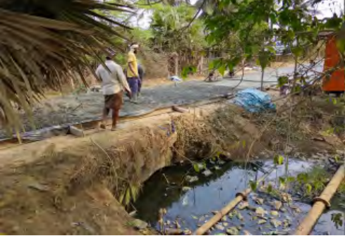
అధికారులు విచారణ చేపట్టి చర్యలు తీసుకోవాలని కోరుతున్నారు.

మొగల్తూరు మార్చి 17 (ప్రభాతవార్త) పశ్చిమగోదావరి జిల్లా మొగల్తూరు మండలం మొగల్తూరు పెద్ద రామాలయం వద్ద నుంచి నిర్మిస్తున్న సిహెచ్ రోడ్ నిర్మాణంపై వరు ఆరోపణలు వెలువెళ్తున్నాయి. గతంలో వేసిన తారు రోడ్డు గుంటల మయం కావడంతో పాత రోడ్డును తొలగించకుండానే దానిపై సిహెచ్ రోడ్డు నిర్మిస్తున్నారని మంగళవారం స్థానిక ప్రజల నుంచి ఆరోపణలు వ్యక్తం అవుతున్నాయి. కొనెక్కోడు డ్రైన్ క్రాసింగ్ వద్ద ట్రిటివ్ కాలంలో నిర్మించిన కాలం చెల్లిన కల్యర్లు పైనే ప్రస్తుతం సీసీ రోడ్ నిర్మిస్తున్నారని దీనివల్ల ప్రమాదం జరిగే అవకాశం ఉందనడం ప్రయాణికులు ప్రయాణికుల సౌకర్యార్థం సంబంధిత అధికారుల స్పందించి న్యాయావహరమైన రహదారి నిర్మించాలని ప్రయాణికులు స్థానిక ప్రజలు అసంతృప్తి వ్యక్తం చేస్తున్నారు. ఈ వ్యవహారంపై సంబంధిత