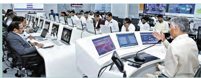
మంగళవారం గ్యాస్ సరఫరాపై అధికారులతో సమీక్షిస్తున్న సిఎం చంద్రబాబు నాయుడు

ప్రస్తుతం 14వేల మె.ట నిల్వలున్నాయి.. ప్రత్యామ్నాయాలపై కూడా అధ్యయనం చేయాలి హాస్పిటల్స్, ఆసుపత్రులు, ఆలయాలకు పూర్తి సరఫరా ఆర్టిజిఎస్ నుంచి గ్యాస్ లభ్యతపై సిఎం చంద్రబాబు సమీక్ష