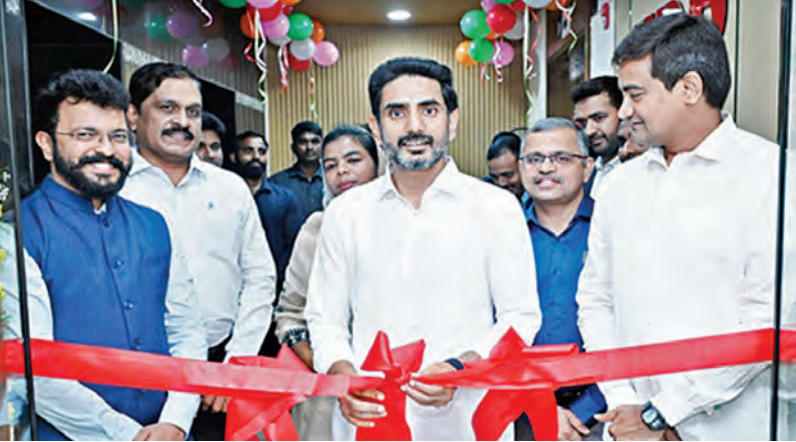
మంగళవారం ఎఐఐఐఐ నూతన కార్యాలయాన్ని ప్రారంభిస్తున్న మంత్రి లోకేశ్. ఇతర అధికారులు కూడా ఉన్నారు.

18-3-2026 బుధవారం సంపుటి: 32 సంఠక: 46 పేజీలు: 12 వెల: 6.50