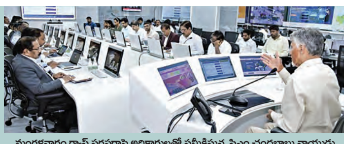
మంగళవారం గ్యాస్ సరఫరాపై అధికారులతో సమీక్షిస్తున్న సిఎం చంద్రబాబు నాయుడు

ప్రస్తుతం 14వేల మె.ట నిల్వలున్నాయి.. ప్రత్యామ్నాయాలపై కూడా అధ్యయనం చేయాలి హాస్టళ్లు, ఆసుపత్రులు, ఆలయాలకు పూర్తి సరఫరా ఆర్టిజిఎస్ నుంచి గ్యాస్ లభ్యతపై సిఎం చంద్రబాబు సమీక్ష