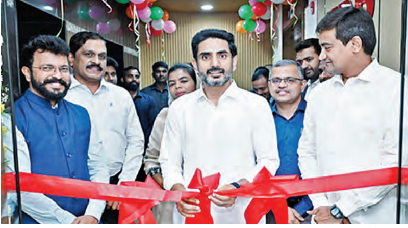
మంగళవారం ఎపిఇడిబి నూతన కార్యాలయాన్ని ప్రారంభిస్తున్న మంత్రి లోకేశ్, చిత్రంలో మంత్రి కొండబాబు నాయుడు

18-3-2026 బుధవారం సంపుటి: 32 సంవత్సరం: 46 పేజీలు: 10+4 వెల: 6.50