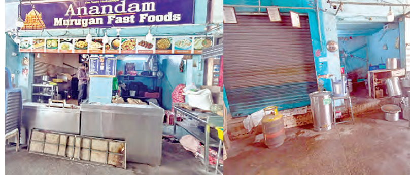
గ్యాస్ లేకపోవడంతో హెజీడ్ కాంప్లెక్స్ లో మాత్రమే ఫ్యాన్లు ఉన్నాయి

తిరుమల, మార్చి 17 ప్రభాతవార్త ప్రతినిధి: ప్రపంచ హిందూ పుణ్యక్షేత్రం తిరుమలను గ్యాస్ కష్టాలు వెంటాడుతున్నాయి. గల్ఫ్ ప్రాంతంలో వరుసగా జరుగుతున్న యుద్ధ వాతావరణం వల్ల కమర్షియల్ ఎలీజీ సిలిండర్లు సరఫరా తగ్గి పోయింది. కమర్షియల్ సిలిండర్లకు డిమాండ్ తో హోటళ్లు, ఫ్యాన్లు సెంటర్లకు కోత విధించారు. డింతో చాలావరకు తెలుగు రాష్ట్రాల్లోనే గాక తమిళనాడు, కర్ణాటక రాష్ట్రాల్లోనూ ఈ ప్రభావం చూపింది. తాజాగా అదివారం నుండి తిరుమలను కమర్షియల్ గ్యాస్ సిలిండర్ల కొరతతో హోటళ్లు, ఫ్యాన్లు తలలు బాదుకుంటున్నాయి. పుణ్యక్షేత్రం తిరుమలపై వ్యాపారులు యాత్రీకుల రద్దీలోనే సమస్యగా సాగుతాయి. భక్తుల సమస్య లేకుండా వ్యాపారులకు పెద్ద డిమాండ్ ఉండదు. అసలే వేసిన సెలవులకు ముందే తిరుమలను భక్తజనం తాకింది. సాధారణ రోజుల్లోనూ కొండపై లక్షమందికిపైగా భక్తులు వస్తుంటున్నారు. వీరంతా పలు రకాల ఆహారపదార్థాలు, ఫ్యాన్లు, ఫుడ్లపై ఆధారపడుతుంటారు. ఇందుకు తిరుమలలో 30వరకు పెద్ద హోటళ్లు నడుస్తుండగా 220కి పైగా ఫ్యాన్లు కేంద్రాలు ఉన్నాయి. వీటన్నింటి ఇప్పుడు కమర్షియల్ గ్యాస్ కొరత వెంటాడుతోంది. గత పదిరోజులుగా హోటళ్లు వ్యాపారులు నెట్వర్క్ యాత్రీకులకు అల్పసౌకర్యం, భోజనాలు, దర్శనాలు వంటకాలకు తయారుచేసి అందించారు. ఇప్పుడు ఏకంగా కమర్షియల్ గ్యాస్పై ప్రభావం చూపడంతో సరఫరా అగిపోయింది. రోజుకు సరాసరి రెండువందల వరకు కమర్షియల్ సిలిండర్లు