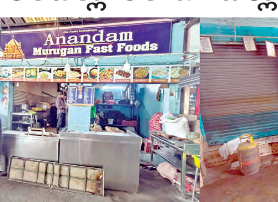
గ్యాస్ లేకపోవడంతో హెజీడ్ కాంప్లెక్స్ లో మాత్రమే ఫ్యాన్లు ఉన్నాయి

పేర్కొన్నారు. గత జూన్ 2025 నుండి స్థానిక రెవెన్యూ, కంపెనీ ప్రతినిధులు పోలీసు బలగాలతో తమను భయభ్రాంతులకు గురిచేస్తూ ఆక్రమణ ఖాళీ చేయమన్నారని రైతులు షర్మిల దృష్టికి తీసుకొచ్చారు. రైతులతో మాట్లాడిన సందర్భంగా షర్మిల దివంగత నేత వైఎస్ రాజశేఖర రెడ్డి ని స్మరించుకున్నారు. “రాజశేఖర రెడ్డి బ్రతికి ఉండి ఉంటే ఇప్పటికే ఇక్కడ పరిశ్రమ స్థాపించబడి ఉండేది. ఈ ప్రాంతం ఎంతో అభివృద్ధి చెంది, రైతులకు, వారి కుటుంబాలకు ఎంతో మేలు జరిగేది” అని ఆమె పేర్కొన్నారు. నేడు ఆరించిన అభివృద్ధి జరగకపోవడం, రైతులు రోడ్డు పడటం అత్యంత బాధాకరమని ఆమె ఆవేదన వ్యక్తం చేశారు. రైతుల సమస్యల పరిష్కారానికి తాను తక్షణమే రంగంలోకి దిగుతానని షర్మిల హామీ ఇచ్చారు. ఈ విషయంలో జిల్లా కలెక్టర్ తో స్వయంగా మాట్లాడి సమస్యను వివరిస్తానని, ఆ అంశం ప్రభుత్వానికి అధికారికంగా లేఖ రాసి 1,100 ఎకరాల భూములను తిరిగి రైతులకు అప్పగించాలని డిమాండ్ చేస్తానని స్పష్టం చేశారు. “రాజన్న మాట సమిష్టి అందాడు మీరు భూములు ఇచ్చారు, నేడు అదే రాజన్న బిడ్డగా నేను మీ తరఫున కోట్లాదిలాక్షం” అని షర్మిల భరోసా ఇచ్చారు. కాంగ్రెస్ పార్టీ రైతులకు అండగా నిలుస్తుందని, పోలీసులు, ప్రభుత్వం చేస్తున్న అన్యాయాన్ని ఎదిరిస్తామని ఆమె స్పష్టం చేశారు.