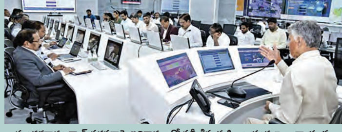
మంగళవారం గ్యాస్ సరఫరాపై అధికారులతో సమీక్షిస్తున్న సీఎం చంద్రబాబు నాయుడు

ప్రస్తుతం 14వేల మె.ట నిల్వలున్నాయి.. ప్రత్యామ్నాయాలపై కూడా అధ్యయనం చేయాలి హాస్టెళ్లు, ఆసుపత్రులు, ఆలయాలకు పూర్తి సరఫరా ఆర్టిజిఎస్ నుంచి గ్యాస్ లభ్యతపై సీఎం చంద్రబాబు సమీక్ష