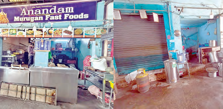
గ్యాస్ లేకపోవడంతో హోటల్ కాంప్లెక్స్ లో మూతబడిన ఫ్యాస్ ఫుడ్

వాడకం ఉంటుందని వ్యాపారుల కథనం. ఇప్పుడు యుద్ధం ప్రభావంతో గ్యాస్ సమస్య తిరుమలను తాకింది. కమర్షియల్ గ్యాస్ కొరత తీవ్రంగా కనిపిస్తోంది. కొండ్రేపల్లి సిఆర్.ఓ., హెచ్.డి, డిబి రోడ్డు ప్రాంతాల్లో చిన్న హోటళ్లు, ఫ్యాస్ ఫుడ్ సెంటర్లు నడుస్తున్నాయి. వీటి నిర్వాహకులు గ్యాస్ అందక ఇబ్బందులు పడుతున్నారు. రెండు రోజుల క్రిందట ఓ డ్రైవేట్ గ్యాస్ ఏజెన్సీ నిర్వాహకుడు కమర్షియల్ గ్యాస్ సిలిండర్లను తిరుమలకు తీసుకురావడంతో స్థానిక వ్యాపారులు అద్భుతంగా. గ్యాస్ కోసం పెద్ద ఎత్తున గుమిగూడారు. తమకు సిలిండర్లు ఇవ్వకుండా ఇతరులకు ఎలా సరఫరా చేస్తారని ప్రశ్నిస్తూ వారు ఆగ్రహం వ్యక్తం చేశారు. ఇప్పటి పరిస్థితుల్లో తిరుమలలో దాదాపు అత్యధికశాతం హోటళ్లు, ఫ్యాస్ ఫుడ్ కేంద్రాలు మూతపడి పరిస్థితిలో వచ్చింది. గ్యాస్ కొరత సమస్య