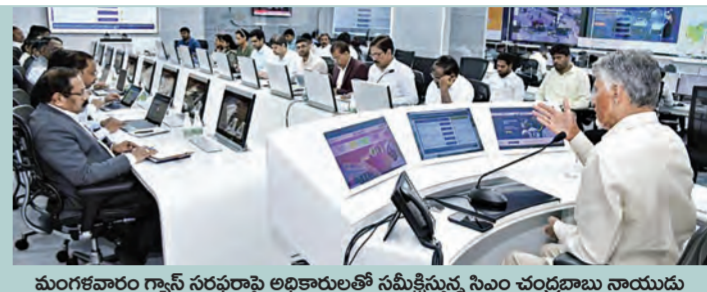
మంగళవారం గ్యాస్ సరఫరాపై అధికారులతో సమీక్షిస్తున్న సీఎం చంద్రబాబు నాయుడు

హాస్టళ్లు, ఆసుపత్రులు, ఆలయాలకు పూర్తి సరఫరా అట్రిజీఎస్ నుంచి గ్యాస్ లభ్యతపై సీఎం చంద్రబాబు సమీక్ష