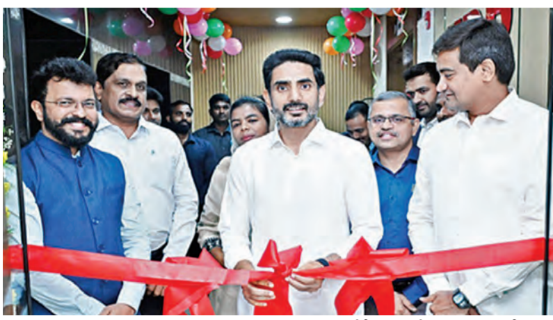
మంగళవారం ఎపిఇడిబి నూతన కార్యాలయాన్ని ప్రారంభిస్తున్న మంత్రి లోకేశ్, చిత్రంలో మంత్రి కొండపల్లి శ్రీనివాస్

శ్రీకాకుళం 18-3-2026 బుధవారం సంపుటి: 32 సంపుటి: 46 పేజీలు: 16 వెల: 6.50