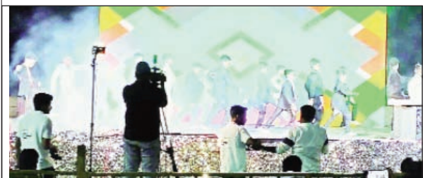
ఉండాలని.. అప్పుడే వారు ఉత్తమ పౌరులుగా తీర్చిదిద్దబడతారని వారు