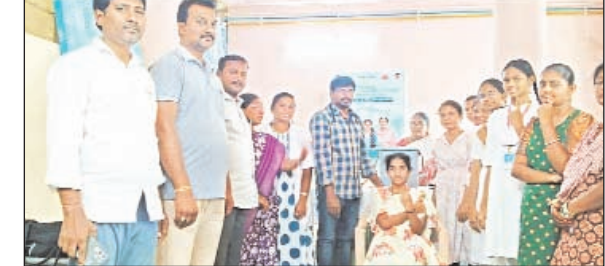
స్కూల్ను సందర్శించి అక్కడ ఉన్న పిల్లలందరికీ పూర్తి ఆరోగ్య పరీక్షలు నిర్వహించి, అవసరమైన వారికి తగిన చికిత్స అందించారు. ఈ సందర్భంగా పిల్లలకు వ్యక్తిగత పరిశుభ్రత, శుభ్రత యొక్క ప్రాముఖ్యత, చేతులు సబ్బుతో కడుక్కోవడం వంటి అంశాలపై ప్రాక్టికల్ డెమోతో అవగాహన కల్పించారు. అలాగే సమతుల్య ఆహారం తీసుకోవడం ద్వారా ఆరోగ్యాన్ని కాపాడుకోవచ్చని అన్నారు. ఈ కార్యక్రమంలో వైద్య సిబ్బంది, పాఠశాల సిబ్బంది పాల్గొన్నారు.