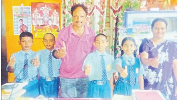
విద్యార్థులను అభినందిస్తూ, హార్షం వ్యక్తం చేశారు, తల్లిదండ్రులు ప్రముఖులు, ఉపాధ్యాయులు, విద్యార్థులను అభినందించారు.