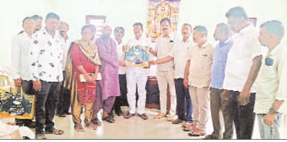
సోదరులు మండల రెవెన్యూ సిబ్బంది తదితరులు పాల్గొన్నారు.