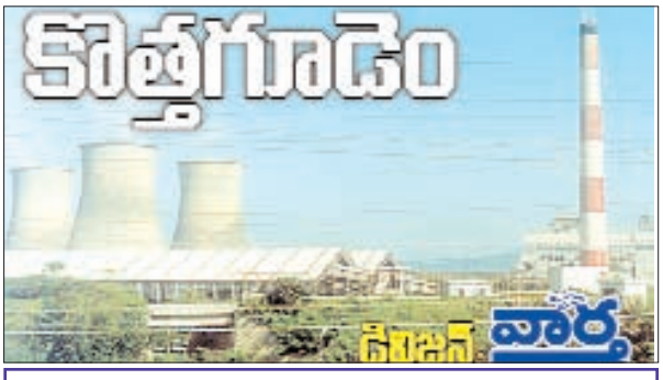
చుంచుపల్లి, జూలూరుపాడు, సుజాతనగర్