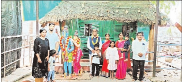
దేవాలయం వద్ద ఆలయ మర్యాదలతో ఆయన్ను అధికారులు ఆలయ పూజారులు ఆలయంలోనికి తీసుకుని వెళ్లి వెళ్లారు అనంతరం చైర్మన్ కుటుంబ సభ్యులు స్వామి వారికి ప్రత్యేక పూజలు నిర్వహించారు వర్షశాల వర్తితన ఆలయ అధికారులు పూజారులు చైర్మన్ కి వివరించారు దేవాలయం పక్కనే ఉన్న గోదావరి నది లో బోటు షికారు చేశారు ఈ కార్యక్రమంలో పలువురు ఎస్సీ కాంపౌండ్ అధికారులు మండల అధికారులు తదితరులు పాల్గొన్నారు.