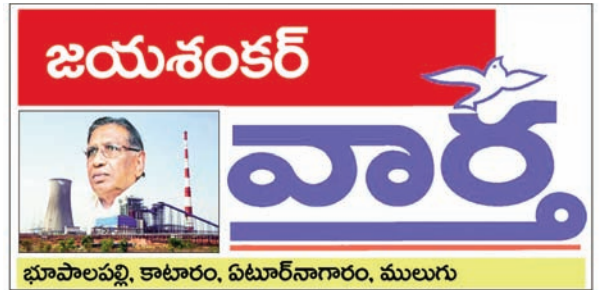
భూపాలపల్లి, కాటారం, ఏటూర్ నాగారం, ములుగు

లోంగిపోయిన నక్కలైట్లకు గృహ వసతి తో పాటు వ్యవసాయ భూమిని ఇవ్వాలని, వెల్చూర్ జెన్కో ద్వారా విడుదల అవుతున్న బూడిద వలన దుబ్బుపల్లి గ్రామ ప్రజలు ఇబ్బంది పడుతున్నారని కావునా ఆ గ్రామాన్ని తరలించాలని కోరారు. భూపాలపల్లి మండలం గొల్ల బుద్ధారం, అజానగర్, నందిగూడు, రాంపూర్ గ్రామాల్లో ఇందిరమ్మ ఇళ్ల లబ్ధిదారులను ఫార్మేట్ అధికారులు ఇబ్బంది పెట్టకుండా ప్రభుత్వం జాగ్రత్తలు తీసుకోవాలని కోరారు. అదే విధంగా నూతనముగా ఏర్పాటు అయిన కొత్తపల్లి గోరి మండలంలో పోలీసు స్టేషన్ భవనము లేదు, కావునా నూతన పోలీసు స్టేషన్ భవనమునకు మంజూరి ఇవ్వాలని ప్రాథమిక ఆరోగ్య కేంద్రంను కూడా ఏర్పాటు చేయాలని కోరారు.