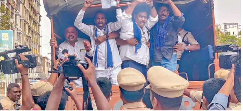
వైసీపీ ఎంపీల మాల నాయకులను అరెస్టు చేసిన పోలీసులు