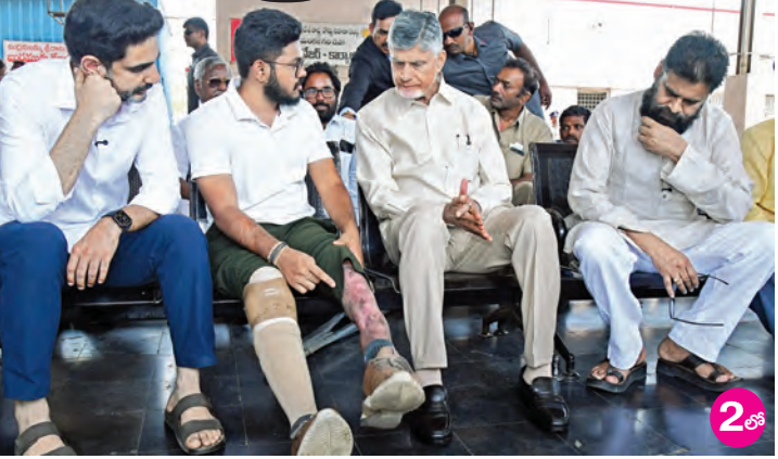
బుధవారం దివ్యాంగులతో మాట్లాడుతున్న సిఎం చంద్రబాబు. చిత్రంలో డి.సిఎం పవన్, మంత్రి లోకేశ్

వారికి ఆత్మస్థైర్యం కల్పించే చర్యలు తీసుకొంటున్నారా. 6వేలు పింఛన్ ఇస్తున్న ప్రభుత్వం మాదే 5 రకాల బస్సుల్లో దివ్యాంగులకు ఇక ఉచిత ప్రయాణం: సిఎం చంద్రబాబు దివ్యాంగులతో కలిసి బోజనం చేసిన సిఎం, మంత్రి లోకేశ్