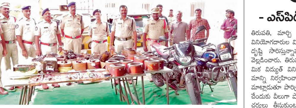
తిరుపతి, మార్చి 18 ప్రభాతవార్త ప్రతినిధి: తిరుపతి జిల్లా పోలీసులు పనితీరును మరోసారి రుజువుచేసుకుని రెండు జిల్లాల్లో విద్యుత్ ట్రాన్స్ ఫార్మర్ల చోరీలకు పాల్పడిన ఐదుగురు అంతర్ జిల్లా డొంగలను అరెస్ట్ చేశారు.