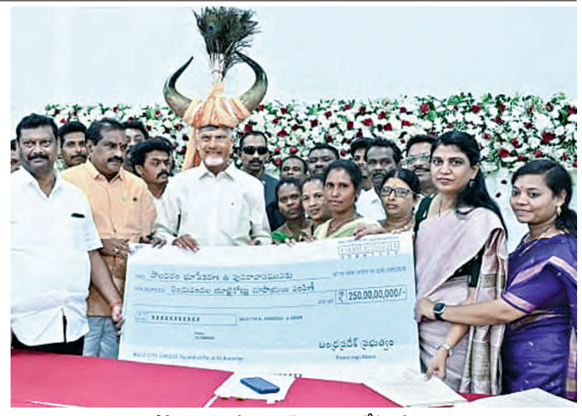
బుధవారం పోలవరం నిర్వాసితులకు చెక్కును అందచేస్తున్న సీఎం చంద్రబాబు

పలు జిల్లాలకు పిడుగుపాటుతో కూడిన వర్షాలు