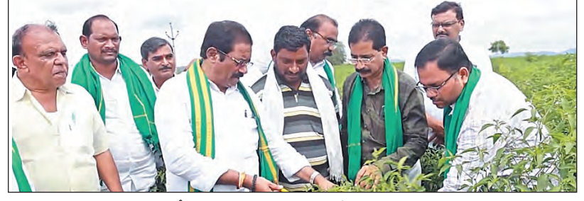
ప్రచారం నిర్వహించి రైతులతో ముఖాముఖంగా మాట్లాడి సాధకబాధకాలను అడిగి తెలుసుకున్నారు. ప్రత్యేక వ్యవసాయం సాగు పంటలను పరిశీలించారు. ప్రభుత్వం అమలు చేస్తున్న అన్ని పథకాలను సమీక్షించి, పీఎం కిసాన్ పథకాల గురించి రైతులకు వివరించారు. రైతు సంక్షేమమే ధ్యేయంగా ప్రభుత్వం పనిచేస్తోందన్నారు. కార్యక్రమంలో నాయకులు, వ్యవసాయ శాఖ అధికారులు రైతులు పాల్గొన్నారు.

బొల్లపల్లి, మార్చి 18, ప్రభాతవార్త: మండలంలో వెల్లటూరు గ్రామంలో జరిగిన రైతన్నా మీ కోసం కార్యక్రమంలో ప్రభుత్వ చీఫ్ విప్ జీ.పీ అంజనేయులు పాల్గొన్నారు. స్వయంగా గ్రామంలో ఇంటింటి