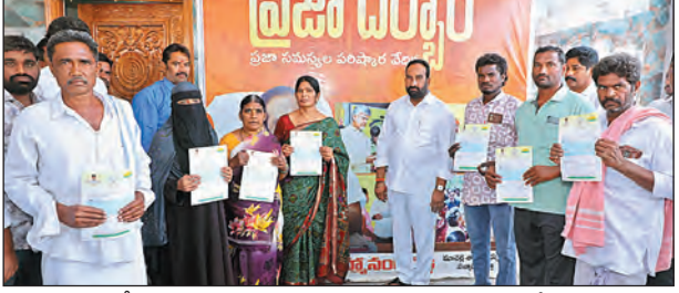
ప్రతి ఒక్కరికీ ప్రభుత్వ సాయం అందుతుందని భరోసా ఇచ్చారు. కార్యక్రమంలో కూటమి పార్టీల ముఖ్య నాయకులు, కార్యకర్తలు, లద్దీరూకు పెద్దసంఖ్యలో పాల్గొన్నారు.