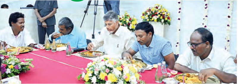
బుధవారం దివ్యాంగుల అధ్యక్షులతో కలిసి భోజనం చేస్తున్న సీఎం చంద్రబాబు

విజయవాడ, మార్చి 18, ప్రభాతవార్త ప్రత్యేకం: దివ్యాంగులకు భరోసాను కలిపిస్తామని ఏపీ సీఎం చంద్రబాబు నాయుడు స్పష్టం చేసారు. దివ్యాంగులు అంటే విభిన్న ప్రతిభావంతులు. సమస్యను అధిగమించి విజయాలు సాధించే శక్తి ఉన్న వాళ్ళని సీఎం చంద్రబాబు కొనియాడారు. వారు ఎవ్వరికీ తీసిపోని సృజనాత్మక శక్తి కలిగి, అధ్యులు చేయగలిగే శక్తివంతులన్నారు. తమ ప్రభుత్వం గతంలో చేయలేకపోయిన ద్వారా దివ్యాంగులకు సహాయం చేసామని వివరించారు. ప్రైవేటీకరణతో పాటు తమ అభ్యుత్సాహం నింప