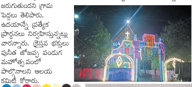
నేడు పునీత జోజప్ప పండుగ పెడకూరపాడు, మార్చి 18 ప్రభాతవార్త: మండల పరిధిలోని జలాలపురం గ్రామంలో గురువారం పునీత జోజప్ప తిరుణాల మహోత్సవం జరుగుతుంది గ్రామ పెద్దలు తెలిపారు. ఉదయాన్నే ప్రత్యేక ప్రార్థనలు నిర్వహిస్తున్నట్లు వారున్నారు. క్రైస్తవ భక్తులు పునీత జోజప్ప పండుగ మహోత్సవంలో పాల్గొనాలని ఆలయ కమిటీ కోరారు.