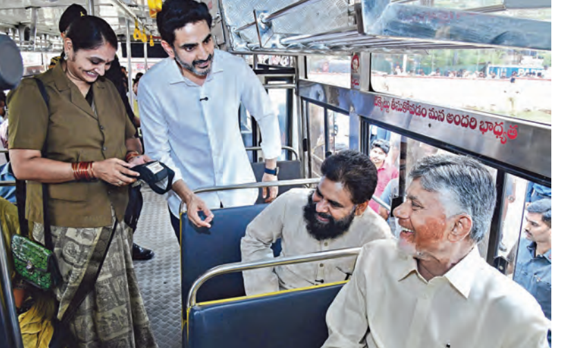
బస్సులో సీఎం చంద్రబాబు. ది.సిఎం పవన్ కళ్యాణ్ లకు దీర్ఘక్షు కొనుగోలు చేస్తున్న మంత్రి నారా లోకేశ్

దివ్యాంగ శక్తిని ప్రారంభించిన సీఎం చంద్రబాబు రాష్ట్ర వ్యాప్తంగా 11.16 లక్షల మందికి లబ్ధి