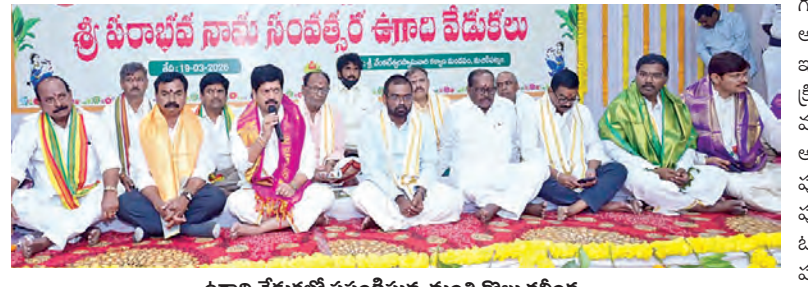
ఉగాది వేడుకల్లో ప్రసంగిస్తున్న మంత్రి కొల్లు రవీంద్ర

గృహం(కృష్ణా), మార్చి 19, ప్రభాతవార్త : భారతీయ సంస్కృతి సాంప్రదాయాలను పరిరక్షించుకోవాలిని బాధ్యత ప్రతిబింబింపై ఉందని కొల్లు ఎన్టీ జేశామా మంత్రి కొల్లు రవీంద్ర పిలుపునిచ్చారు. గురువారం ఉదయం కృష్ణా జిల్లాకేంద్రమైన మచిలీపట్నంలో బహుపేట వెంకటేశ్వరస్వామి కళ్యాణ మండలంలో దేవాలయ దర్శనార్థం చేస్తున్నప్పుడు, ప్రజలు వాస్తవాల గమనిస్తుండాలన్నారు. దేవుడిని కుడా రాజకీయాలకు ఇప్పటి ప్రభుత్వం వాడుకుంటుందన్నారు. ఆడవిడ్డల రక్షణ లేకుండా పోయిందన్నారు. మత్తులో ఆ పార్టీ నేతలు జోగుతున్నారు. అసత్యాలతో సీఎం చంద్రబాబు ప్రజలను మోసగిస్తున్నారు. ఉగాది వేడుకలకు పార్టీ ముఖ్యనేతలు, నాయకులు, మాజీ మంత్రిలు, ఎమ్మెల్యేలు, ఎమ్మెల్యేలు హాజరయ్యారు.