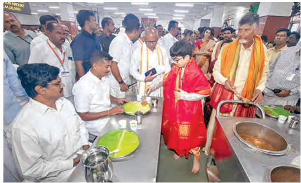
దేవాన్స్ పుణ్యోద్యమ భక్తులకు అన్నప్రసాదం వితరణ (ప్రతిఫోటో)