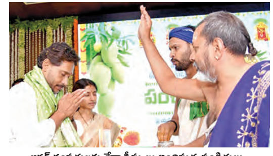
జగన్ దంపతులకు వేదాంతీస్వరూపం అందిస్తున్న పండితులు