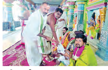
కోసలో వైభవంగా పరాభవ నామ సంవత్సరం వేడుకలు