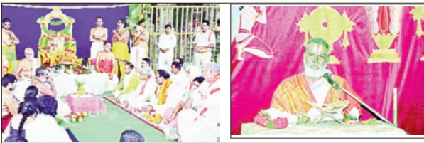
యాదగిరిగుట్ట మార్చి 19 ప్రభాతవార్త :

యాదగిరిగుట్ట శ్రీ లక్ష్మీనరసింహస్వామి దేవస్థానంలో ఉగాది పరాభవ నామ సంవత్సరం పురస్కరించుకొని పంచాంగ శ్రవణం ను ఆలయ అర్చకులు అధికారులు ఘనంగా నిర్వహించారు ఈ సందర్భంగా పంచాంగ కర్తలు స్వామివారిని ఉద్దేశించి మాట్లాడుతూ స్వామివారికి స్వాతీ నక్షత్రం తులారాశి ఐదు ఆదాయం 14 ఖర్చుగా చెప్పగా అమ్మవారికి అశ్విని నక్షత్రం మేషరాశి 11 ఆదాయం 5 ఖర్చుగా వివరించారు ఈ సందర్భంగా ఆలయ అర్చకులు మాట్లాడుతూ స్వామివారి ఖర్చు అధికంగా ఉన్న ఈ ఖర్చును అమ్మవారు చేసుకుంటూ దేవస్థానానికి తగినటువంటి ఆదాయాన్ని అమ్మవారి రూపంలో సమకూర్చుతుందని ఆలయ అర్చకులు వివరించారు. అలాగే ఈ