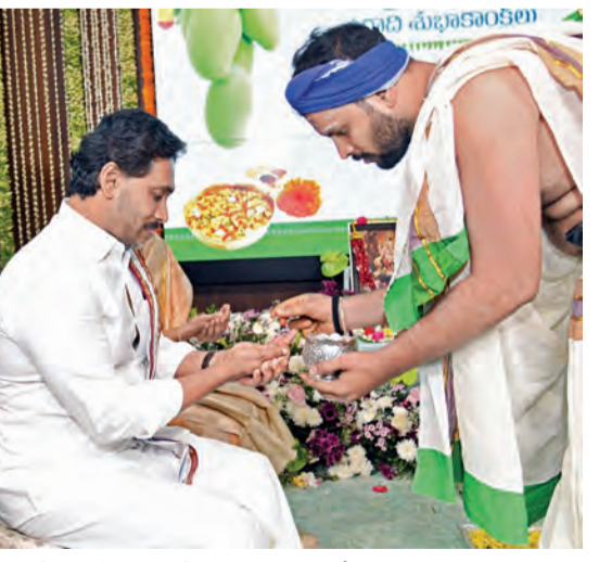
తాడేపల్లిలో ఉగాది వేడుకల్లో పాల్గొని స్వీకరిస్తున్న వైఎస్ జగన్

మార్పు ఖాయం! చంద్రబాబు చెప్పినట్లు అబద్ధాలే >>2 ఉగాది వేడుకల్లో మాజీ సిఎం జగన్