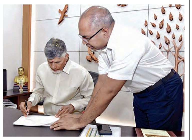
సిఎం సహాయనిధి దస్త్రంపై సంతకం చేస్తున్న ముఖ్యమంత్రి చంద్రబాబు

అమరావతి దేవతల రాజధాని అవ్వాలని కోరుకున్నా.. స్వల్ప, మధ్య, దీర్ఘకాలిక ప్రణాళికలతో రాష్ట్రాభివృద్ధి శ్రీ పరాభవ నామ సంవత్సరంలో అందరికీ మంచి జరగాలి ఉగాది వేడుకల్లో సిఎం చంద్రబాబు