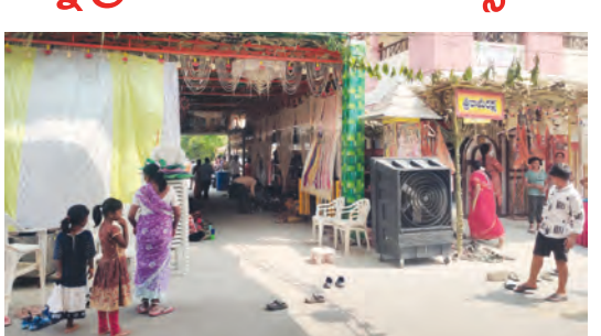
ఏపీఎంఐ కాలనీలోని ధర్మనిలయం

హైదరాబాద్, మార్చి 20 ప్రభాతవార్త: హైదరాబాద్ డివిజన్ గడ్డి అన్నారం ఏపీఎంఐ కాలనీలోని ధర్మ నిలయంలో శ్రీరామ నవమి మహోత్సవాలను ఘనంగా నిర్వహిస్తున్నారు. ఉగాది నుండి శ్రీరామ నవమి వరకు తోమ్మిది రోజుల పాటు ఉత్సవాలను నిర్వహిస్తారు. ఉత్సవాలలో భాగంగా ప్రతి రోజు ఉదయం నగర సంకీర్తన, శ్రీరామ పూజ, ఏక రుద్రము, శ్రీ సీతాయక, శ్రీ సీతారామ వందనామి, శ్రీ ఆంజనేయ స్వామి హోమము, శ్రీ సత్యనారాయణ స్వామి ప్రత్యేక నిర్వహిస్తున్నారు. ఉదయం అల్పాహారం, మధ్యాహ్నం అన్నప్రసాదము ఏర్పాటు చేశారు. ప్రతి రోజు విశేష కార్యక్రమాలలో భాగంగా 20వ తేదీ శుభ్రవారం సాయంత్రం అలిండియా రేడియో హారీశ్రీకలలు పి.రమణ భాగవతార్చన భక్తి గోష్ఠి..శక్తి గోష్ఠి..పాఠిక, 21వ తేదీ శనివారం సాయంత్రం రంజని సిస్టర్స్చే భజన సమ్మేళనం, 22వ తేదీ ఆదివారం సాయంత్రం సుమిత్ర యాత్ర అసోసియేషన్చే శ్రీరామ పాదుశా పట్టాభిషేకం నాటకం, 23వ తేదీ సోమవారం సాయంత్రం మధుస్థపేట భజన మండలిచే శ్రీ సీతా రామవందనల ఉరేగింపు, 24వ తేదీ మంగళవారం సాయంత్రం జనరంజని వారిచే వీర అభిమన్యుడు బుర్రకథ, 25వ తేదీ బుధవారం సాయంత్రం