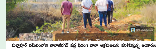
పల్లెపాట నమిందర్ల బాలాజీగర్ వద్ద సింగి గంగా అభ్యుదయ కేంద్రాన్ని అధికారులు