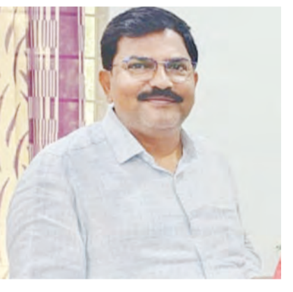
మాట్లాడే వేలాలు 2026-2027 ఆర్థిక సంవత్సరానికి సంబంధించి సంక, దిన కూరగాయల మార్కెట్, బస్టాండు ఫీజులు, ఇతర వసూలు మరియు మాంసపు మార్కెట్ కు సంబంధించిన వేలాలు నిర్వహించబడుతాయని మున్సిపల్ కమీషనర్ తెలిపారు. ఈ నెల 23వ తేదీని నిర్వహించవలసి ఉండగా పరిపాలనా కారణముల దృష్ట్యా 25.03.26కు వాయిదా వేసినట్లు కమీషనర్ పేర్కొన్నారు. ఈ వేలాల పట్ల ఆసక్తి కలిగిన వారు వాల్యూయర్స్ సర్టిఫికేట్ పాటు ధరావర్తనను కమీషనర్ నందికొట్కూరు మున్సిపాలిటీ పేరుపై డి.డి. రూపంలో చెల్లించి బహారం వేలం నందు పాల్గొన వచ్చని ఆయన తెలిపారు.