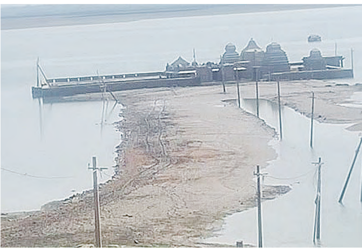
బయరదనీరు ఉంటుందన్నారు. 23వ తేదీ జరిగే అవకాశం ఉంది అలయ పురోహితులు సోమవారానికి సంగమేశ్వరాలయానికి తోలిపూజ వివరించారు.

కొత్తపల్లి, మార్చి 20, ప్రభాతవార్త: శ్రీలైల జలాశయ నీటిపట్టు క్రమంగా తగ్గడంతో సంగమేశ్వర గర్భాలయం బయటపడింది. నీటిలో బయటపైన వివరాలు, ఇతర దేవతల మూర్తుల అలయ పురోహితరుల తెలవజేయ రఘురామేశ్వర ప్రత్యేక పూజలు నిర్వహించి మంగళహారతులు ఇచ్చారు. శుక్రవారం శ్రీలైల జలాశయం నీటిపట్టు 839 అడుగులకు చేరింది. అలయ ప్రహారీ లోపల ఉండే రెండు అడుగుల నీళ్లు బయటకు వెళ్లితే శ్రీలైల జలాశయంలో 837 అడుగులకు చేరుకుంటే వేపదారి శివలింగం దర్శనభాగ్యం కలుగుతుందని ఆయన తెలిపారు. ఎండల తీవ్రతకు క్రమంగా ఎగువ ఉపామహేశ్వర అలయం నుంచి దిగువ ఉపామహేశ్వర అలయం రూపాంతరం చెందనున్నట్లు ప్రాచీన సంగమేశ్వరాలయం శుభ్రం చేస్తామన్నారు. అంతరకు అలయంలో అలయప్రాకారంలో