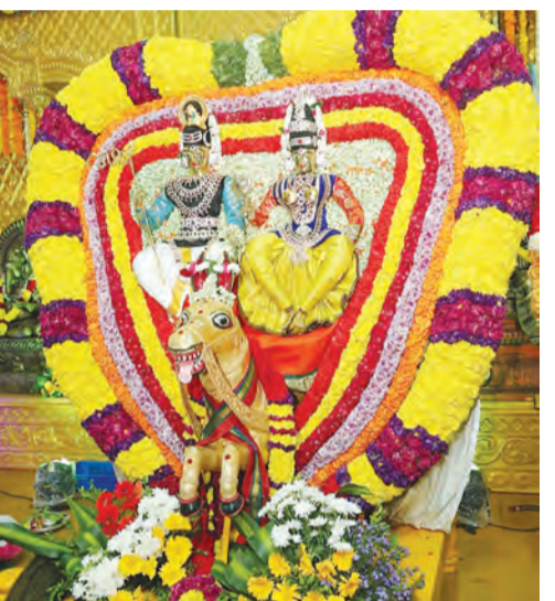
శ్రీలైలంప్రాజేక్ష, మార్చి 20, ప్రభాతవార్త :

ఉగాది మహోత్సవాలలో భాగంగా శుక్రవారంనాడు సాయంత్రం శ్రీస్వామి అమ్మవార్లకు అశ్వవాహన సేవ, అమ్మవారికి భ్రమ రాజాదేవి నిజాలంకరణ కార్యక్రమాలు నిర్వహించడం జరిగింది. వాహనసేవలో భాగంగా శ్రీస్వామి అమ్మవారి ఉత్సవమూర్తులను అశ్వ వాహనంపై వేంపేట చేయించి ప్రత్యేక పూజాది కాలు నిర్వహించబడ్డాయి. తరువాత అలయ ప్రాకారోత్సవం నిర్వహించడం జరిగింది. అశ్వవాహనంపై శ్రీస్వామి అమ్మవార్లను దర్శించడం వలన సమన్వయ తీరిపోతాయని, సంతానార్థకుల సంశాసన కలుగుతుందని చెప్పబడుతోంది. నిజాలంకరణ: ఉగాది మహోత్సవాలలో చేయబడుతున్న అలంకారంలో భాగంగా ఈ సాయంత్రం శ్రీఅమ్మవారి ఉత్సవమూర్తిని భ్రమరాజాదేవి నిజాలంకరణ స్వరూపంలో అలంకరించేయడం జరిగింది. అశ్వవాహనంపై శ్రీస్వామి అమ్మవార్లను దర్శించడం వలన సమన్వయ తీరిపోతాయని, సంతానార్థకుల సంశాసన కలుగుతుందని చెప్పబడుతోంది. అలంకారంలో భాగంగా ఈ సాయంత్రం శ్రీఅమ్మవారి ఉత్సవమూర్తిని భ్రమరాజాదేవి నిజాలంకరణ స్వరూపంలో అలంకరించేయడం జరిగింది. అశ్వవాహనంపై శ్రీస్వామి అమ్మవార్లను దర్శించడం వలన సమన్వయ తీరిపోతాయని, సంతానార్థకుల సంశాసన కలుగుతుందని చెప్పబడుతోంది. కాగా పూజాదికాల తరువాత అలయప్రాంగణంలో ప్రదక్షణగా ఉత్సవ మూర్తులకు ప్రాకారోత్సవం నిర్వహించడం జరిగింది. సాయంత్రం జరిగిన ప్రాకారోత్సవంలో ఉగాది ఉత్సవాలు ముగిసాయి.