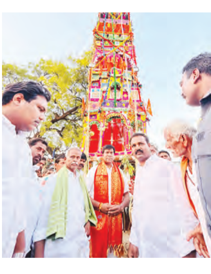
శుక్రవారం సాయంత్రం అంగరంగవైభవంగా ప్రభోత్సవంను వైభవంగా జరుపుకున్నారు. 100 అడుగుల ప్రభం ప్రత్యేకంగా అలంకరించి అంజనేయ స్వామి దేవాలయం నుంచి ఈశ్వరదేవాలయం వరకు ప్రభోత్సవం చేపట్టారు. పలు రాజకీయ పాలీ నాయకులు జాతర కార్యక్రమంలో పాల్గొని ప్రత్యేక పూజలు చేశారు. ఈ కార్యక్రమంలో గ్రామపెద్దలు, మహిళలు, యువకులు పెద్ద ఎత్తున పాల్గొన్నారు.

- ఎమ్మెల్యే టీపీ ప్రత్యేక పూజలు గోనెగడ్డ, మార్చి, 20, ప్రభాతవార్త: మండల పరిధిలోని బైలుప్పలలో ఉగాది వర్సెదినం సందర్భంగా శుక్రవారం చెన్నకేశవస్వామి జాతర మహోత్సవం భక్తులుభక్తిశ్రద్ధలతో అంగరంగవైభవంగా జరుపుకున్నారు. ఈ జాతరను 24 గంటల పాటు ఘనంగా గ్రామ ప్రజలు జరుపుకుంటారు. ఈ సందర్భంగా శుక్రవారం వసంతోత్సవంను ఆనందోత్సవాలమధ్య ఘనంగా జరుపుకున్నారు. స్వామి వారి జాతరకు చుట్టూ వచ్చే గ్రామాల నుండి గాక ఇతర జిల్లాల నుంచి భక్తులు పెద్ద సంఖ్యలో హాజరయ్యారు. స్వామి వారికి ప్రత్యేక పూజలు చేసి మొక్కలు తీర్చుకున్నారు. స్వామి వారి దేవాలయంను రంగురంగుల విడుదల దీపాలతో అలంకరించారు. గ్రామంలో జాతర సందర్భంగా నాటకాలు, నృత్య, గీతాపాటల కార్యక్రమాలు చేపట్టారు. అలాగే