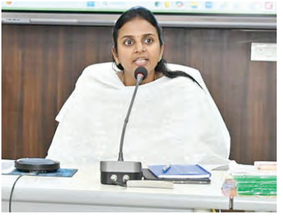
పేదరిక నిర్మూలనకు చర్యలు తీసుకోవాలని తెలిపారు. యువతకు ఉపాధి అవకాశాలు పెంపేందుకు నైపుణ్యాభివృద్ధి కార్యక్రమాలను విస్తరించాలని, పరిశ్రమల అవసరాలకు అనుగుణంగా క్షేత్ర ఇంజనీరులను నూరించారు. వేసవి పరీక్షలను దృష్టిలో ఉంచుకుని చెరువుల పూడిక తొలగింపు, కాలువల శుభ్రత, మైక్రో ఇరిగేషన్ మరమ్మత్తులు వంటి పనులను వర్షాకాలానికి ముందే పూర్తి చేయాలని ఆదేశించారు. ఆసుపత్రుల్లో బయోమెడికల్ వ్యర్థాల నిర్వహణను 24 గంటల్లో పూర్తి చేసేలా చర్యలు తీసుకోవాలని, వాక్సిన్ గవర్నెన్స్ సేవలపై ప్రజల్లో అవగాహన పెంపొంది అధికారులకు ఆదేశించారు. ఈ సమావేశంలో జిల్లా అధికారులు పాల్గొన్నారు.

పనితీరు గుర్తులు, పాఠశాలలు, ఆరోగ్య కేంద్రాల పనితీరుపై అధికారులు ప్రత్యేక పర్యవేక్షణ చేపట్టాలని తెలిపారు. జిల్లాలో తలసరి ఆదాయం పెంపు కోసం వ్యవసాయం, పరిశ్రమలు, సేవారంగాలలో ఉత్పాదకత పెంపుపై ప్రత్యేక దృష్టి పెట్టాలని పేర్కొన్నారు. విద్యారంగంలో మెరుగైన ఫలితాల సాధన ద్వారా ప్రజల్లో సానుకూల ఆభిప్రాయం పెంపొందించాలన్నారు. పాఠశాల మోలిక పనతులు, మధ్యాహ్న భోజన వ్యవస్థల అమలు వంటి అంశాలను సమీక్షించి లోపాలు ఉన్న చోట వెంటనే సరిదిద్దాలని ఆదేశించారు. పెండింగ్ పనులను వేసవ సెలవుల్లో పూర్తి చేయడానికి కార్యాచరణ రూపొందించాలని సూచించారు. ప్రతి ఇంటికి మోలిక సదుపాయాల సర్వే జిల్లాలోని ప్రతి ఇంటికి గృహం, తాగునీరు, విద్యుత్, శానిటేషన్, గ్యాస్, ఇంటర్నెట్ వంటి మోలిక సదుపాయాలపై సమగ్ర డేటా సేకరించాలని ఆదేశించారు. లేని సదుపాయాల కోసం ప్రత్యేక కార్యాచరణ ప్రణాళిక సిద్ధం చేయాలని సూచించారు. షి4 కార్యక్రమం ద్వారా పేద కుటుంబాలకు మార్గదర్శకలను అనుసంధానం చేసి