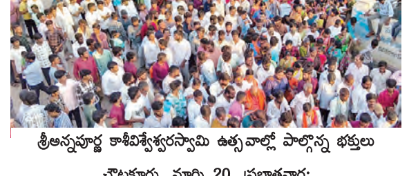
శ్రీఅన్నపూర్ణ కాశీవిశ్వేశ్వరస్వామి ఉత్సవాల్లో పాల్గొన్న భక్తులు

చౌటూరు, మార్చి 20, ప్రభాతవార్త: మండలకేంద్రమైన చౌటూరులోని శ్రీఅన్నపూర్ణ కాశీవిశ్వేశ్వరస్వామి ఉత్సవాలు నేత్రపంపిణీ కార్యక్రమం కొనసాగుతున్నాయి. ఉత్సవాలలో భాగంగా రెండవ రోజైన శుక్రవారం పోచమ్మ, దుర్గామల్లతోపాటు గ్రామవేదవేదకు ఊరబోనాలు నిర్వహించారు. డిజి వచ్చుకొని, డోల, వాయిద్యాల మధ్య బోనాల ఊరేగింపు అంగరంగవైభవంగా నిర్వహించారు. ఉత్సవాలలో భాగంగా అగ్ని గుండాల కార్యక్రమం కొనసాగింది. ఊరేగి మహిళల పూసకాణి భక్తులను ఆకట్టుకున్నాయి. జాతరకు హైదరాబాద్ నుంచి ప్రత్యేకంగా సర్పంచి పార్కుల రంగురెడ్డి కళాకారులను రప్పించి సాంస్కృతిక కార్యక్రమాలను నిర్వహించారు.