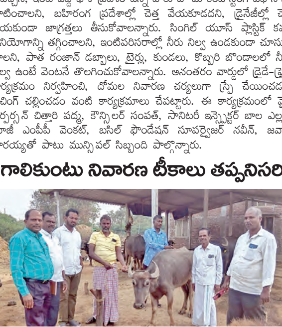
గాలికుంటు టీకాలు వేస్తున్న సర్పంచి