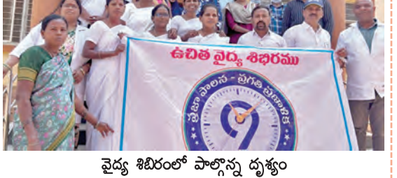
వైద్య శిబిరంలో పాల్గొన్న దృశ్యం