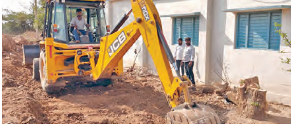
జడ్పీపాచ్ ఎన్ కు ప్రహారీ గోడ నిర్మాణం పనుల దృశ్యం