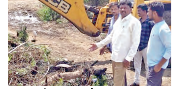
పాలిశుద్ధు పనులు చేపడుతున్న దృశ్యం