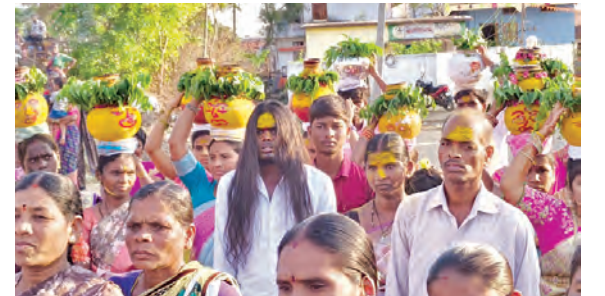
బోనాలు ఊరేగిస్తున్న గ్రామస్థులు

విలిపిడి, మార్చి 20, ప్రభాతవార్త: ఊది పండుగను పురస్కరించుకొని మండల పరిధిలోని అజ్ఞమర్తి భక్తులు ఎర్రపోచమ్మకు ఘనంగా బోనాలు నిర్వహించారు. మండలపరిధిలోని అజ్ఞమర్తి ఊరుశివారులో ఉన్న ఎర్రపోచమ్మకు శుక్రవారం గ్రామస్థులు బోనాలు ఘనంగా నిర్వహించారు. అమ్మవారిని అలంకరించేందుకు ప్రభుత్వ ఊరేగింపుగా, డబ్బు వాయిదాతో, డోలపంపుకత్తో మహిళాభక్తులు బోనాలను ఎత్తుకొని అమ్మవారి ఆలయంచుట్టూ ప్రదక్షిణలుచేసి బోనాలు సమర్పించుకున్నారు. ఆనంతరం ధూప, దీప, నైవేద్యాలు, తీపిపదార్థాలను అమ్మవారికి సమర్పించి మొక్కులు చెప్పించుకున్నారు.