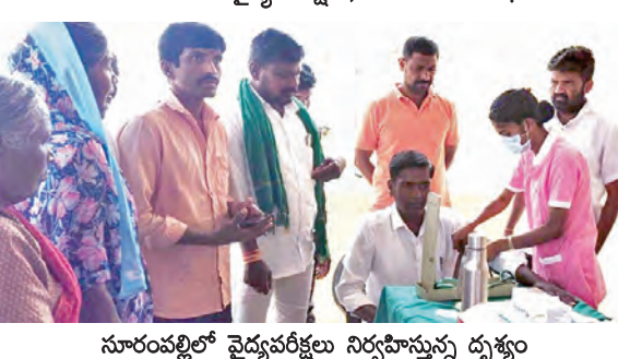
సూరంపల్లిలో వైద్యపరీక్షలు నిర్వహిస్తున్న దృశ్యం