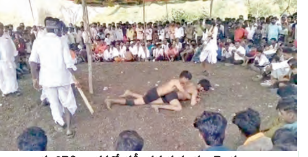
మావిసెల్లి జాతరలో కుస్తీ పడుతున్న మల్లయోధులు

నాగల్ గడ్డ, మార్చి 20, ప్రభాతవార్త: మండల పరిధిలోని మావిసెల్లి గ్రామంలో శ్రీవెన్నుజనకేశ్వర జాతర మహోత్సవాలు నేత్రపంపిణీ కార్యక్రమం కొనసాగుతున్నాయి. ఉత్సవాలను పురస్కరించుకుని గ్రామస్థులతోపాటు పరిసర గ్రామాల నుంచి భక్తులు పెద్దసంఖ్యలో చేరుకుని చెన్నబసవేశ్వరుడిని దర్శించుకున్నారు. జాతరను పురస్కరించుకుని నిర్వహించిన కుస్తీ పోటీల్లో మల్లయోధులు కన్నవచ్చారు. కుస్తీపోటీల్లో ప్రతిభ వాటిని మల్లయోధులకు బహుమతులను అందజేశారు. ఉత్సవాలకు హాజరైన భక్తులు అన్నదాన కార్యక్రమం నిర్వహించారు.