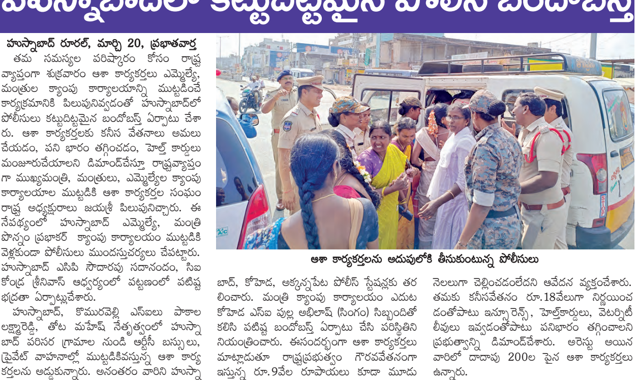
ఆశా కార్యకర్తలను అదుపులోకి తీసుకుంటున్న పోలీసులు