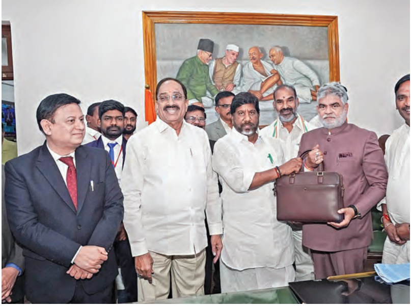
శుక్రవారం అసెంబ్లీ స్పీకర్ ప్రసాద్ కుమార్ కు బడ్జెట్ ప్రతులను సమర్పిస్తున్న డి.సిఎం భట్టి విక్రమార్క