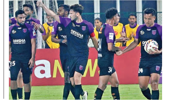
ఇండియన్ సూపర్ లీగ్లో మొత్తం 14 జట్లు తలపడుతున్నాయి.