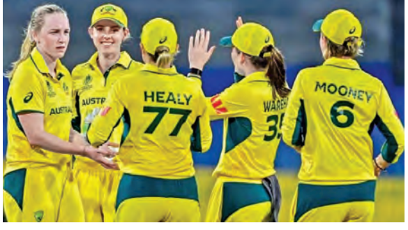
ఆస్ట్రేలియా బ్యాట్స్మెన్లు విండీస్ బ్యాట్స్మెన్లను పరిమితం చేశారు.

కింగ్స్టన్: వెస్టిండీస్ పర్యటనను ఆస్ట్రేలియా విమెస్ జట్టు గెలుపుతో ప్రారంభించింది. తొలి టీ20 మ్యాచ్లో వెస్టిండీస్ను దాని సొంతగడ్డపై 43 పరుగుల తేడాతో ఓడించింది. వికెట్ల కీపర్ కమి బ్యాట్స్మెన్ టెంట్ మూసీ సూపర్ హాఫ్ సెంచరీతో మొదటి బ్యాట్టింగ్ చేసిన ఆస్ట్రేలియా విమెస్ 20 ఓవర్లలో 6 వికెట్లకు 164 పరుగులు చేసింది. జార్జియా వోల్(8), లిట్టిఫీల్డ్(6) రూపంలో ఆస్ట్రేలియా తొందరగానే రెండు వికెట్లు కోల్పోయింది. మరో ఎండ్లో దూకుడుగా ఆడిన టెట్ మూసీ(79)... ఎల్లెన్ పెర్(36) అండగా మూడో వికెట్కు సంపర్తి భాగస్వామ్యం చేసింది. ఈ క్రమంలో టెట్ మూసీ 55 బంతుల్లో 7 ఫోఫ్, 2 సిక్స్లతో 79 రన్స్ సాధించింది. పెర్ 32 బంతుల్లో 36 రన్స్ చేసింది. మిగతా బ్యాట్స్మెన్ల విమెస్ నిరాశాజనకం. విండీస్ బౌలర్లలో డీన్డ్రా డాట్టోన్ మూడు వికెట్లు, చినైస్ పాల్ రెండు వికెట్లు తీశారు. అనంతరం వెస్టిండీస్ను 21 పరుగులతో ఆస్ట్రేలియా బౌలర్లు పరిమితం చేశారు. విండీస్ జట్టులో ఓపెనర్ క్వియానా జోసెఫ్(45) టామ్ స్కోరర్గా నిలిచింది. 39 బంతుల్లో 7 ఫోఫ్లతో 45 రన్స్ చేసింది. మిగతా వారిలో స్పాన్సీ టెల్ 38 రన్స్ సాధించింది. ఆస్ట్రేలియా బౌలర్లలో అలనా కింగ్ మూడు వికెట్లు పడగొట్టింది.