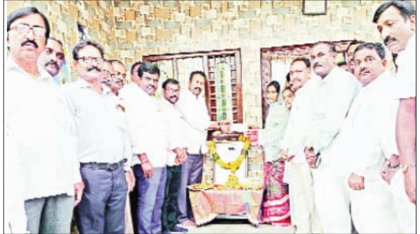
గుండాల మండలం వస్తా కొండూరు ప్రాథమిక పాఠశాలలో ఎస్జీటీ