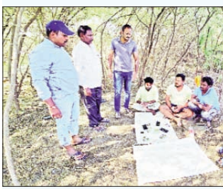
హాలియా ప్రభాతవార్త మార్చి 20

హాలియా పట్టణం ఎస్పీ కాలనీ శివారు ప్రాంతం లో శుక్రవారం కొందరు వ్యక్తులు పేకాట ఆడుతున్న సమాచారం అందడంతో దాడి చేసి ముగ్గురిని పట్టుకోగా, మరో ముగ్గురు పరారైనట్లు ఎస్పీ ప్రశాంత్ తెలిపారు. వారి నుంచి రూ. 2760 నగదు, 4 సెల్ ఫోన్లు స్వాధీనం చేసుకుని కేసు నమోదు చేసినట్లు ఎస్పీ పేర్కొన్నారు.