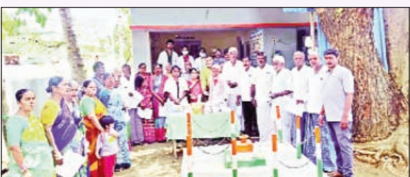
రాజాపేట మార్చి 20 ప్రభాతవార్త