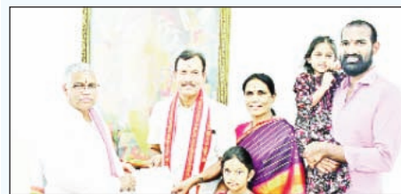
యాదగిరిగుట్ట మార్చి 20 (ప్రభాత వార్త) :