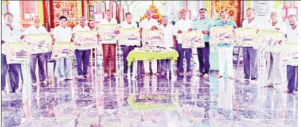
కొండమల్లేపల్లి, మార్చి 20, ప్రభాత వార్త:

కొండమల్లేపల్లి శ్రీ కోదండ రామస్వామి వారి బ్రహ్మోత్సవాల్లో భాగంగా స్వామివారి కల్యాణం, జాతర జరగనున్నట్లు కొండమల్లేపల్లి శ్రీ సీతారామ చంద్రమూర్తిశ్వర, శ్రీఅయ్యప్ప దేవస్థానం కమిటీ వారు తెలిపారు. ఈనెల 26 గురువారం రోజున గణపతిపూజ, నవగ్రహ హోమంతో బ్రహ్మోత్సవాలు ప్రారంభమవుతుండగా, 27 శుక్రవారం మధ్యాహ్నం శ్రీ సీతారాముల కల్యాణ మహోత్సవం, అదే రోజు రాత్రి సాంస్కృతిక కార్యక్రమాలు నిర్వహిస్తున్నట్లు పేర్కొన్నారు. అదేవిధంగా 28 శనివారం రోజున రథోత్సవం గ్రామ వీధుల్లో సీతారాముల ఊరేగింపు మహోత్సవం జరుగనున్నట్లు ఆలయ కమిటీ ఒక ప్రకటనలో తెలిపారు. భక్తులు అధిక సంఖ్యలో పాల్గొని స్వామివారి తీర్థప్రసాదాలు స్వీకరించి తరించగలరని వారు పేర్కొన్నారు.