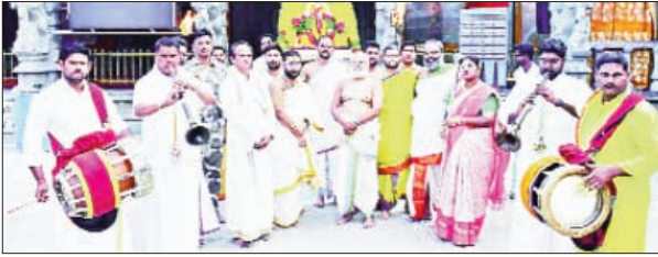
యాదగిరిగుట్ట మార్చి 20 (ప్రభాతవార్త):

యాదగిరిగుట్ట లక్ష్మీ నరసింహస్వామి దేవస్థానం లో శుక్రవారం ఆంధ్రా అమ్మ వారికి ఉంజలి సేవోత్సవం ఆలయ అర్చకులు ఘనంగా నిర్వహించారు ఈ సందర్భంగా ఉదయం అమ్మవారికి పంచ సూక్తాలతో ఆలయ అర్చకులు చదివి వంచోపనిషత్తులు దశ శ్రాంతలతో ఘనంగా ఆభిషేకం గావించారు అనంతరం అమ్మవారికి పట్టు వస్త్రాలను ధరింపజేసి వివిధ రకాల పుష్ప మాలికలతో షోభాయమానంగా ఆలంకారం చేశారు.