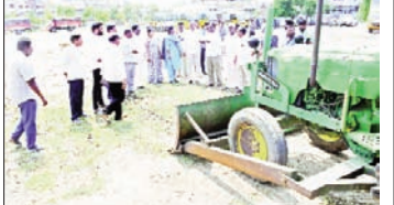
చౌటుప్పల్, మార్చి 21 ప్రభాతవార్త