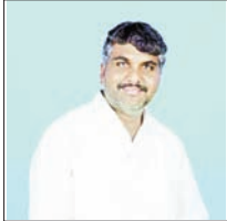
సంస్థాన్ నారాయణపురం, మార్చి 21 ప్రభాతవార్త