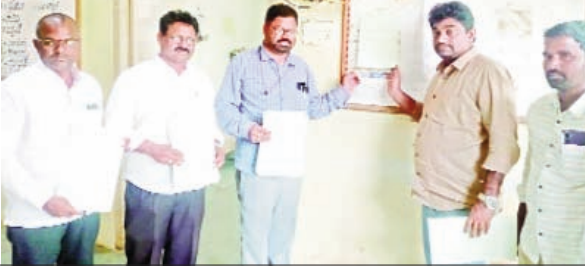
కొండమల్లేపల్లి, మార్చి 20, ప్రభాత వార్త: