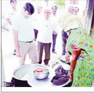
చౌటుప్పల్, మార్చి 20