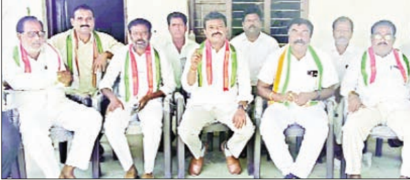
మోటకొండూర్, మార్చి 20, ప్రభాత వార్త: