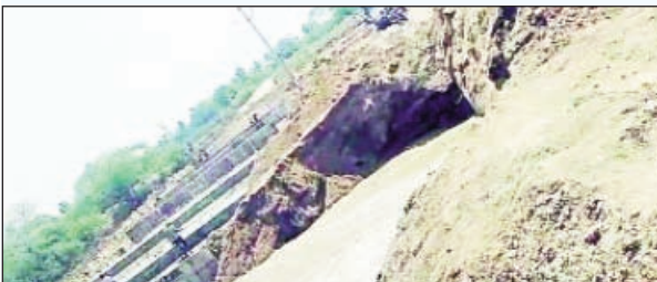
రాజాపేట మార్చి 20 ప్రభాతవార్త

రాజాపేట యాదగిరిగుట్ట ప్రధాన రోడ్డు మీద ఉన్న పొట్టిమరి వాగు లో నీరు వస్తుండడంతో రాకపోకలకు అంతరాయం ఏర్పడినది. మల్లన్న సాగర్ నుంచి తుంగతుర్తి నియోజకవర్గానికి సాగునీరు అందించడానికి నీటిని ఇటీవల విడుదల చేశారు. అయితే పొట్టి మరి వాగు హై లెవెల్ బ్రిడ్జి నిర్మాణం పనులు ఇటీవలనే మొదలుపెట్టడం ప్రస్తుతం నీరు రావడంతో వేసిన పైపుల మీద నుంచి నీరు ప్రవహించడంతో వాహనదారులకు రాకపోకలకు అంతరాయం ఏర్పడినది. వాహనదారులు రఘునాథపురం మీదుగా, లేదా బేగంపేట మీదుగా రాజాపేటకు చేరుకోవాలని పోలీసులు భారీకేడ్లు ఏర్పాటు చేశారు దారి మళ్లిస్తున్నారు. ప్రయాణికులు జాగ్రత్తలు పాటించాలని కోరుతున్నారు.