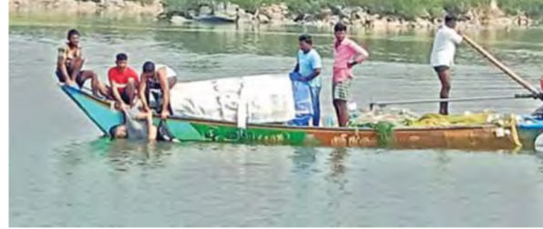
విద్యార్థుల మృతదేహాలను వెలికి తీస్తున్న రెస్కూ బృందం

విద్యార్థుల మృతదేహాలను వెలికి తీస్తున్న రెస్కూ బృందం విద్యార్థుల మృతదేహాలను వెలికి తీస్తున్న రెస్కూ బృందం