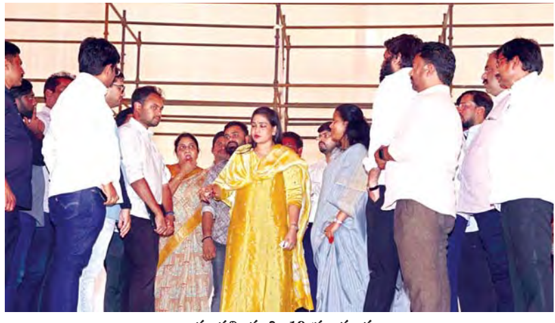
అనకాపల్లి, మార్చి 19 ప్రభాతవార్

అధికారులకు దిశా నిర్దేశం చేసిన జిల్లా కలెక్టర్ విజయ క్రిష్ణన్ -స్టీల్ ప్లాంట్ శంకుస్థాపనకు పటిష్ట ఏర్పాట్లు