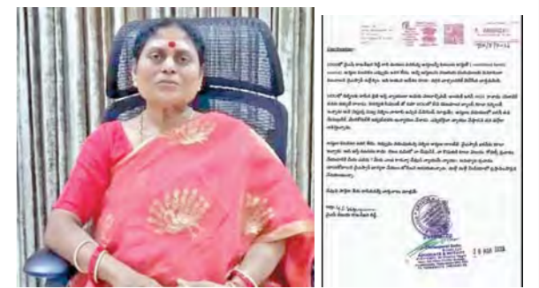
వైఎస్ విజయమ్మ స్వామి వేదం(అధికార)లో నోటిఫై విషయం చేసిన లేఖ

విజయవాడ, మార్చి 21 ప్రభాతవార్తాపత్రిక: విజయవాడ, మార్చి 21 ప్రభాతవార్తాపత్రిక: