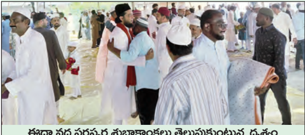
ఈడ్గా వద్ద పరస్పర శుభాకాంక్షలు తెలుపుకుంటున్న దృశ్యం

బెజ్జూర్ మండల కేంద్రంలోని ఈడ్గా మైదానంలో రంజాన్ పర్వదినాన్ని పురస్కరించుకుని శనివారం ముస్లిం సోదరులు ప్రత్యేక ప్రార్థనలు నిర్వహించారు. ఈ సందర్భంగా మోలానా రంజాన్ ఉపవాసాల ఆపశ్యకతను, సమాజ్ ప్రాముఖ్యతను భక్తులకు వివరించారు. మండలంలోని మర్రిడి, బెజ్జూర్, కుకుడ గ్రామాల్లో ఈడ్గాల వద్ద ప్రార్థనలు జరగగా, గోల్కొండ గ్రామంలో మసీదులో సమాజ్ నిర్వహించారు. సమాజ్ అనంతరం ఒకరినొకరు ఆలింగనం చేసుకుని పండుగ శుభాకాంక్షలు తెలుపుకున్నారు. కాగజ్ నగర్ రూరల్, మార్చి 21, ప్రభాతవార్త నెలరోజుల పాటు కఠిన ఉపవాస దీక్షలు ఆచరించిన ముస్లిం సోదరసోదరీమణులు శనివారం పవిత్ర రంజాన్ (కాద్ ఉల్ ఫితర్) పండుగను భక్తిశ్రద్ధలతో జరుపుకున్నారు. ఉదయం నుంచే కాగజ్ నగర్ పట్టణంలో పాటు పరిసర గ్రామాల్లోని ఈడ్గాలకు పెద్ద సంఖ్యలో భక్తులు చేరుకుని ప్రత్యేక సమాజ్ నిర్వహించారు. తెల్లవారుజామునే కొత్త దుస్తులతో, ఆనందోత్సాహాల మధ్య కుటుంబ సమేతంగా ప్రార్థనలకు హాజరయ్యారు. ప్రార్థనల అనంతరం మత పెద్దలు ప్రవక్త మహమ్మద్