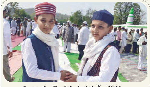
శుభాకాంక్షలు తెలుపుకుంటున్న ముస్లిం సోదరులు