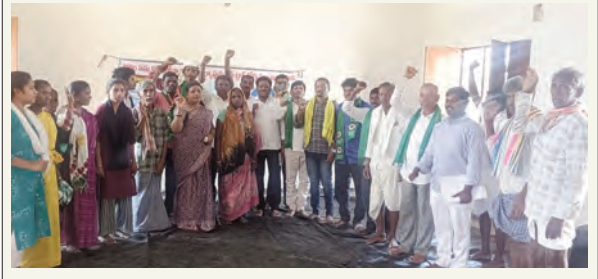
రౌండ్ టేబుల్ సమావేశంలో పాల్గొన్న నాయకులు

పవిత్ర రంజాన్ పర్వదినాన్ని పురస్కరించుకొని శనివారం కెరమెరి మండల కేంద్రంలో పాటు మండలంలోని అన్ని గ్రామాలలో ఇడ్గా వద్ద సామూహిక ప్రార్థనలో ముస్లిం సోదరులు పాల్గొన్నారు. ఈడ్ మాబూర్క్ అంటూ ఒకరినొకరు శుభాకాంక్షలు తెలుపుకుంటూ ఒకరినొకరు ఆలింగనం చేసుకున్నారు.