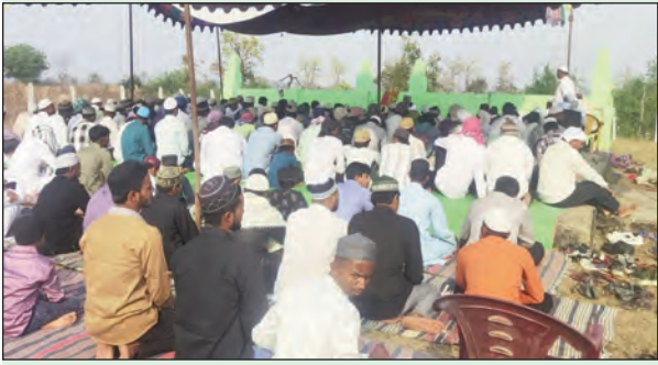
బెల్లంపల్లి, మార్చి 21, ప్రభాతవార్త