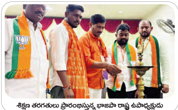
శిక్షణ తరగతులు ప్రారంభిస్తున్న భాజపా రాష్ట్ర ఉపాధ్యక్షుడు