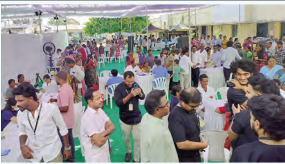
రోగులకు పరీక్షలు నిర్వహిస్తున్న వైద్యబృందం