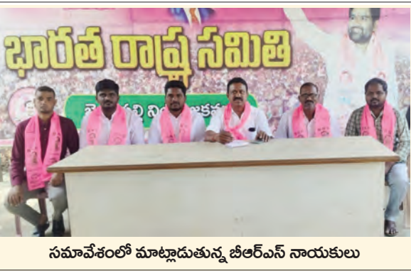
సమావేశంలో మాట్లాడుతున్న బీఆర్ఎస్ నాయకులు