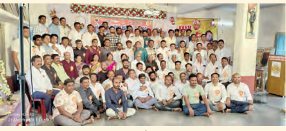
పూర్వ విద్యార్థులతో ఉపాధ్యాయులు