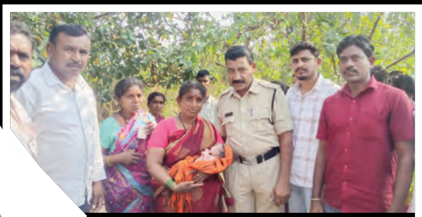
పసికందును పత్తి చేనులో నుంచి బయటకు తీసిన గ్రామస్తులు, పోలీసులు

కాగజ్ నగర్ రూరల్, మార్చి 21, ప్రభాతవార్త : మనసు ముక్కలు చేసే ఘటన... మానవత్వాన్ని గుర్తు చేసిన స్పందన.. కాగజ్ నగర్ మండలంలోని వల్లకొండ గ్రామపంచాయతీ పరిధి సీతానగర్ శివారులో శనివారం చోటుచేసుకుంది. పత్తి చేనులో గుడ్డలో చుట్టి పడేసిన పసికందును గుర్తించిన గ్రామస్తులు ఒక్కసారిగా దిగ్భ్రాంతికి గురయ్యారు. తల్లి ఒడిలో ఉండాలని ఆ పసికందు, ఆకలితో అలమటిస్తూ గుక్కపట్టి ఏడుస్తుండటం అక్కడివారిని కన్నీళ్లు పెట్టించింది.