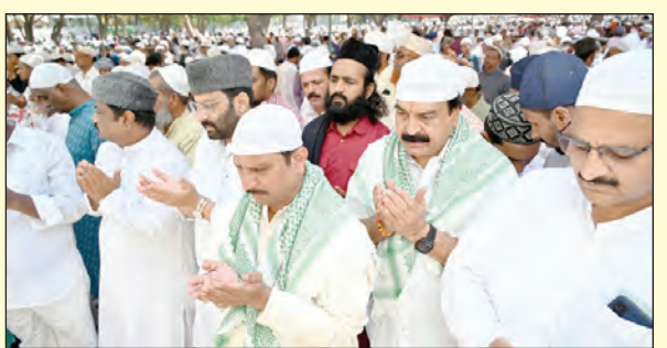
ప్రార్థనల్లో పాల్గొన్న ఎంపీ, ఎమ్మెల్యే మైన్స్ లో నేతలు