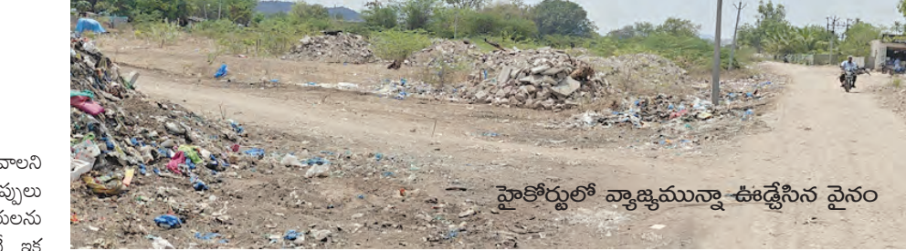
హైకోర్టులో వ్యాజ్యమున్నా ఊడ్లెసిన వైనం

యాడికి(రాడిపత్రి), మార్చి 21, ప్రభావవార్త: ప్రభుత్వం ఓ ఓ పుష్ప భూదండాలపై కఠిన చర్యలు తీసుకోవాలని ఆదేశిస్తున్నా క్షేత్రస్థాయిలో అధికారులు మాత్రం అవకాశాలకు తప్పలు దాస్తూ.. వారికి కోర్టు కాస్తున్నారు. వ్యవస్థలో సంబంధిత అధికారులను లెక్కచేయక, చట్టాన్ని గౌరవించక, కోర్టులను కూడా ధిక్కరిస్తుంటే ఇక తమకు దిక్కలేదని బాధితులు వాపోతున్న వైనం అవస్థలకు గురవుతున్న వ్యవస్థ తీరుకు అడ్డం పడుతోంది. కల్లెడులే అప్లకష్టాలు చోటు చేసుకుంటున్నా సంబంధిత శాఖల అధికారులు ఒకరి మీద ఒకరు నెపం నెడుతుంటే అప్లకష్టం బాధితులను మరింత కుంగిస్తున్నారు. కోర్టు ధిక్కారమైనా సరే ఊడ్లెస్తాం.. మాకెవరు అడ్డు అన్నట్లు వ్యవహారాన్ని నిందితుల తీరు సామాన్యులను భయం దోళనలకు గురి చేస్తోంది. సహజ