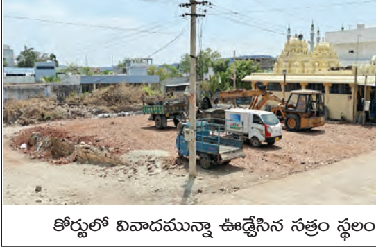
కోర్టులో వివాదమున్నా ఊడ్లెసిన సత్రం స్థలం

మధ్య వివాదం నడుస్తున్న రూ. 8 కోట్లకు పైగా విలువైన ఈ స్థలంలో సాగుతున్న రూ. 50 లక్షల పంటను రాత్రికి రాత్రే ఊడ్లెస్తారు. బాధితులు ఎంతో వ్యయం ప్రయాసలకు ఓర్చి అక్రమార్కులు చేసిన అన్యాయంపై ఫిర్యాదు చేసి కేసు నమోదు చేసిన తర్వాత వరకు పోరాడారు. ఊడ్లెసిన వైనం నేరమని తెలిసినా కేసు నమోదైనప్పటికీ తిరిగి ఆదేశ స్థలంలో ఆదేశ నిందితులు వేరేవేల నుంచి వ్యర్థాలు, శిథిలాలను కుప్పలు తెప్పలుగా వదేసి తమ ఆదాపత్యాన్ని వెలుగుతున్నా రైతులను వెలుగుతున్నా అధికారులు చోద్యం చేయకుండా పట్ల పలు విషయాలు వ్యక్తమవు తున్నాయి. ఆదేశ రాయలచెరువులో నగరం లోడ్లలో రూ. కోటికి పైగా విలువైన, అన్నదమ్ముల భాగ పరిష్కారంలో భాగంగా కోర్టులో వివాదం నడుస్తున్న నిత్యాన్ని కూడా ఆ అక్రమాల్లో గత నెల 23న ఊడ్లెస్తారు. ఇదేమని నిలదీయలేని అక్రమాలైన బ్రాహ్మణులు అధికారులందరి చుట్టూ తిరిగినా నిందితులపై నేటికీ కనీస చర్యలు లేవు. ఇలాంటి కోర్టు వివాదాస్పద స్థలాల కోర్టుకైనా అధికారం ఉండాలి.. లేదా సంబంధితులకైనా ఉండాలి. కానీ మధ్యలో మీర పెట్టినమేటి అని ప్రశ్నించే అధికారులు గాని, చట్టాలు గాని, నాయకులు గాని కనుమాపుమేరలో లేకపోవడం విచిత్రం. కోందరు