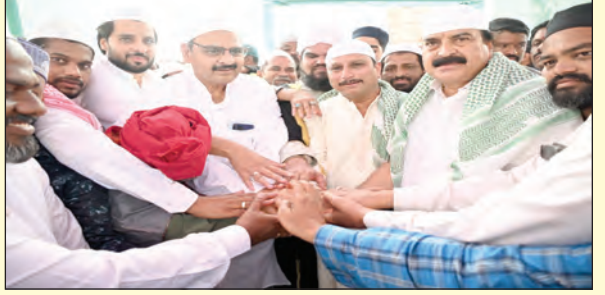
మత సామరస్యానికి ఐక్యతగా నగర ప్రముఖులు

కేటాయించారన్నారు. తల్లికి వందనం కింద ఎంతమంది పిల్లలు ఉన్నా చదివినే విధంగా రూ.15వేలు ఆర్థిక సాయం చేస్తున్నారు. తీరక వధకం వల్ల ముస్లిం మైన్స్ లకు బంబాల్లో అందరు పిల్లలు చదువుకుంటున్నారన్నారు. వారు ఆర్థికంగా, సామాజికంగా ఎదగడమే ప్రభుత్వ లక్ష్యమని ఎమ్మెల్యే దగ్గుపాటి అన్నారు.