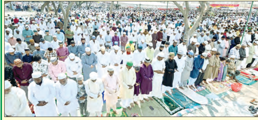
కళ్యాణ మైదానంలో సామూహిక ప్రార్థనలో పాల్గొన్న ముస్లిం నోడరులు