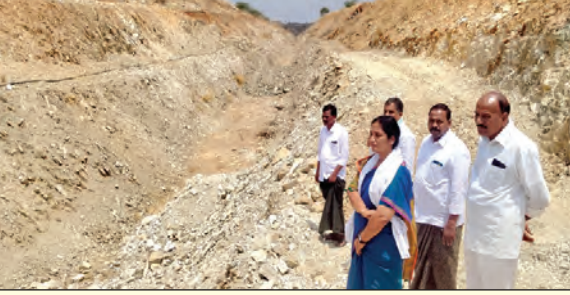
పరిటాల రవీంద్ర సాగునీటి పథకం కాలువ పనులను పరిశీలించిన ఎమ్మెల్యే సునీత

- రాష్ట్ర ఎమ్మెల్యే పరిటాల సునీత ఆదేశం - కాలువ పనులను పరిశీలించిన ఎమ్మెల్యే సునీత - ఉపాధి హామీ నిధులతో చేపట్టిన పనులపై ఎమ్మెల్యే సునీత ఫోకస్