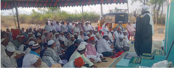
పెద్దమండెం మార్చి 21 ప్రభాతవార్త

మండలంలోని ముస్లిం సోదరులు శనివారం రంజాన్ పండుగసందర్భంగా ముస్లిం సోదరులు ఈదుల్ ఫితరును ఘనంగా జరుపుకున్నారు నెల రోజుల పాటు ఉపసాహారం ఉండి ప్రత్యేక ప్రార్థనలు చేసి నెలవంక చూసిన అనంతరం ఈదుల్ ఫిత్ర ప్రత్యేక ప్రార్థనలు చేస్తూ అనంతరం ఒకరికి ఒకరు అలింగనం చేసుకొని ఈద్ ముఖారక అంటూ శుభాకాంక్షలు తెలుపుకుంటూ ఈ పండుగ ముస్లిం సోదరులకు అతి ముఖ్యమైన పండుగ ఈ పండుగ రోజు అనయాన్నే లేచి స్నానాలు ఆచరించి ప్రత్యేక ప్రార్థనలు చేసి ఇది కాక వెళతారు అనంతరం పేదలకు వస్త్ర దానం ఆర్థిక సాయం అన్నదానం చేయడం ఈ పండుగ యొక్క ముఖ్య ఉద్దేశం ఈ పండుగలు అల్లా కోసం కోరితుల తీర్పడం జరుగుతుంది. అందుకే ఈ పండుగను ముస్లిం సోదరులు ప్రత్యేక శ్రద్ధలతో జరుపుకోవడం జరుగుతుంది