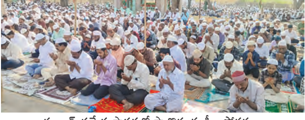
రంజాన్ ప్రత్యేక ప్రార్థనల్లో పాల్గొన్న ముస్లిం సోదరులు