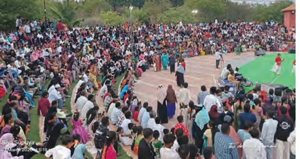
పులివెందుల, మార్చి 21, ప్రభాతవార్త: