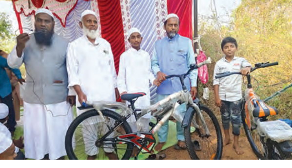
వేంపల్లి: మార్చి 21 ప్రభాతవార్త

రంజాన్ పండుగ సందర్భంగా శనివారం చిన్నారులకు ఉచితంగా సైకిళ్లు పంపిణీ చేశారు.. పవిత్ర మైన రంజాన్ మాసం లో పంచాయతీ పరిధి లో ఉన్న వై ఎన్ మదీనా పురం లో ఉన్న మొహమ్మదియా ఆహాల్ హాదీస్ మసీద్ నందు ఆ ఇద్దరు చిన్నారులు రంజాన్ నెల అంత 5 పూటల నమాజ్, అలాగే నూనీద్ లో సేవలు అందించి నందుకు అయిపా సిద్ధిక మద్రాసా రోజూజమాన్యం ఆధ్వారం లో సైకిళ్లు పంపిణీ చేశారు. నూనీద్ పెద్దలు చేతుల మీదుగా పంపిణీ చేశారు.