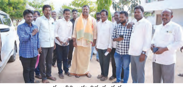
మంత్రిని ఆహ్వానిస్తున్న దృశ్యం