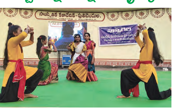
పులివెందుల, మార్చి 21, ప్రభాతవార్త: