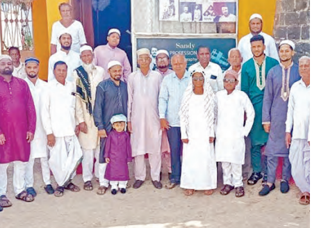
న్యాలేకల్లో శుభాకాంక్షలు తెలుపుతున్న దృశ్యం

న్యాలేకల్, మార్చి 21, ప్రభాతవార్త: 28 ఫిబ్రవరి 2026వరకు పట్టణం వాసువుస్తూలు అందుకున్న రైతులు రైతు భరోసా అందుకునేందుకు ఈ నెల 25వ తారీఖు వరకు ధరఖాస్తులు చేసుకోవచ్చని మండల వ్యవసాయ అధికారి ఎన్ అధికారి వద్ద పేర్కొన్నారు. మండలంలో 943 మంది పట్టణం వాసువుస్తూలు పొందిన వారు రైతు భరోసా కోసం అర్హులు ఉండగా శనివారం వరకు 281 మంది రైతులు రైతు భీమాకై ధరఖాస్తులు చేసుకుని ఉన్నారు. మొగ్గల రైతులు 25వ తేదీ వరకు ధరఖాస్తులు చేసుకునేలా చూసుకోవాలని సూచించారు. రైతు భరోసా కొరకు రైతులు ధరఖాస్తు పత్రంతో పాటు పట్టణం వాసువుస్తూలు, బ్యూరక్ ఖాతా పాసుపుస్తకం, అదార్ కాన్పు జిరాఫుల పత్రాలు జతచేసి సమీపం ఏకకాలం అందచేయాలని మండల వ్యవసాయ అధికారి అధికారి వద్ద మండల రైతులకు సూచించారు.