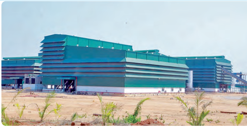
సిఎం రేవంత్ రెడ్డి చేతుల మీదుగా ప్రారంభానికి సిద్దమైన ఆయిల్ ఫాం ఫ్యాక్టరీ

సిద్దిపేట, ప్రభాతవార్త ప్రతినీధి : సిద్దిపేటలో సిఎం రేవంత్ రెడ్డి ఈనెల 22న వరకూ టివి పలు అభివృద్ధి పనులకు ప్రారంభోత్సవాలు, శంకుస్థాపనలు చేయనున్నారు. సిఎం రాక సందర్భంగా నంగినూర్ మండలం నర్మల ఆయిల్ ఫాం ఫ్యాక్టరీ వద్ద పక్కపక్కగా ఏర్పాటు పూర్తి చేశారు. నర్మల ఆయిల్ ఫాం ఫ్యాక్టరీ ఆవరణలోనే హెలిప్యాడ్ ఏర్పాటు చేశారు. హైదరాబాద్ నుంచి బయలుదేరి సాయంత్రం 4 గంటలకు నర్మలకు సిఎం చేరుకుంటారు. నర్మల గ్రామంలో 62 ఎకరాలలో రూ.300 కోట్లతో నిర్మించిన ఆయిల్ ఫాం ఫ్యాక్టరీని ప్రారంభించి ఫైలాన్ ఆవిష్కరిస్తారు. అలాగే ఎన్ఎస్ఎస్ఐ శివారులో 30ఎకరాలలో రూ.78 కోట్లతో నిర్మించిన జిల్లా జైలు కారాగారం, సింథెటిక్ డ్రగ్ స్టోరేజీ, ఆయామ్ ఆసుపత్రి, అర్బన్ హెల్త్ సెంటర్లను నర్మల నుంచి సిఎం ప్రారంభించనున్నారు. అలాగే నర్మల ఆయిల్ ఫాం ఫ్యాక్టరీ ఆవరణలో రూ.80 కోట్లతో నిర్మించ తలపెట్టిన తెలంగాణలోనే మొదటి ఆయిల్ రిఫైనరీ నిర్మాణానికి సిఎం శంకుస్థాపన చేయనున్నారు. ఆయిల్ ఫాం ఫ్యాక్టరీ ఆవరణలో మూడు రోజులకు రైతు మహోత్సవ కార్యక్రమంలో భాగంగా 150 స్టాళ్ళను ఏర్పాటుచేసి ఉత్సాహాలను నిర్వహిస్తారు.