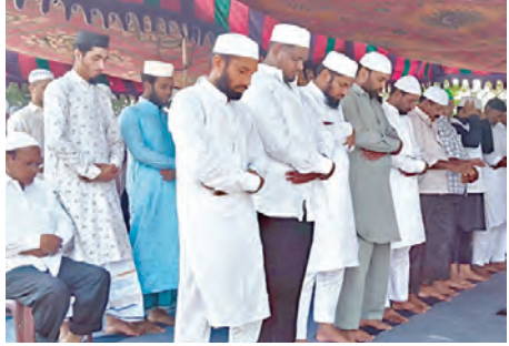
పుల్లూర్లో ఈద్గా వద్ద సమాజ్ చేస్తున్న ముస్లింలు