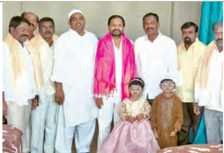
రంజాన్ వేడుకల్లో పాల్గొన్న నరోత్తం