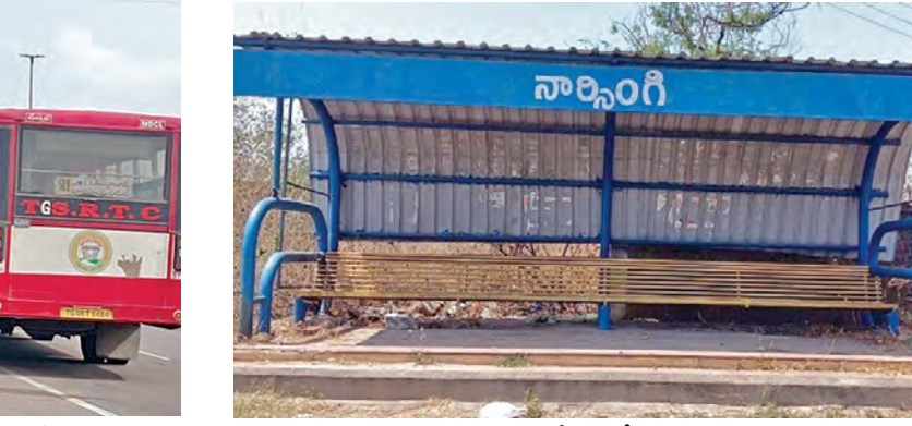
నిరుపయోగంగా నర్సాంగి రోడ్డుపై బస్ స్టేషన్

నీళ్ళ దొరకని పరిస్థితి. చివరికి ఒకటి వచ్చినా, రెండు వచ్చినా అవ్వదు వదాల్సిందే. రోజూ వండల సంఖ్యలో కార్మికులు, విద్యార్థులు ప్రయాణాలు చేస్తారు. బస్ కోసం వేచి చూస్తున్న వారికి ఎండ ఎంత మండిపోతున్నా నిలువ నీడ ఉండదు, వర్షం వడితో తడవాలిందే. కారణం అవసరం ఉన్న చోట మండల ఆఫీస్ అవతల అర కిలోమీటర్ దూరంలో సర్వీసు రోడ్డుపై బస్ స్టేషన్ ను నిర్మించడం. ఉరికి దూరంగా ఉండడం వల్ల బస్ స్టేషన్ ముందుభాగాలకు అడ్డగా మారాయి. ఇక వృద్ధులకు, మహిళా ప్రయాణికుల ఇబ్బందులు వర్షనాశితం. ఎండకు ఇరువైపుల ఉన్న చెట్ల వద్ద వడిగాపులు కాయాలైన పరిస్థితి. పనుల నిమిత్తం వివిధ గ్రామాల నుంచి మండల కేంద్రానికి వచ్చేవారికి మౌలిక వసతులు అందని ద్రాక్షగా మారింది. దాహం వేస్తే గుక్కడు