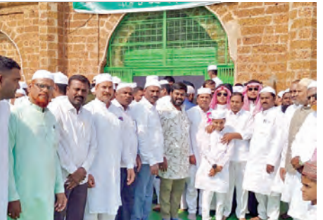
శుభాకాంక్షలు తెలుపుతున్న ఎమ్మెల్యే మాజీకొర్రావు