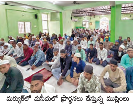
మరుకొల్లో మనీషులో ప్రార్థనలు చేస్తున్న మున్సిలరు