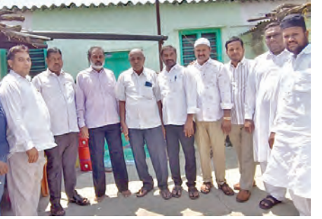
ముస్లింలకు రంజాన్ శుభాకాంక్షలు తెలుపుతున్న దృశ్యం