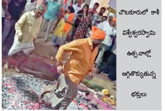
చౌకురూరులో కాశీ విశ్వేశ్వరస్వామి ఉత్సవాలలో భక్తులు

చౌకురూరు, మార్చి 21, ప్రభాతవార్త : మండల కేంద్రంలోని శ్రీఅన్న పూర్ణ నమేత కాశీవిశ్వేశ్వరస్వామి ఉత్సవాలు శనివారంతో ముగిసాయి. ఉత్సవాలు ముగింపు రోజైన శనివారం ఆలయ ఆవరణలో ఉదయం గోపాల కాళ్యలు, మధ్యాహ్నం 3 గంటల వరకు సామీ భక్తులు తిరిగారు. ఆలయ ఆవరణలో శివమత్తులతో పాటు పలువు భక్తులు స్వామిని స్మరిస్తూ ఆగ్రగంధాలు తోకారు. రాత్రిక అందంగా అలంకరించిన భక్తమును గ్రామంలోని పురపేటకు గుండా ఉడిగింపు నిర్వహిస్తూ ఆయానీకేతుకుని ఆలయంలో పూజా కార్యక్రమాలు నిర్వహించారు. ఆలయానికి చేరుకున్న భక్తులకు అన్నదాన వితరణ చేశారు.