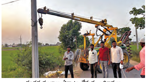
నూతన స్తంభాలు ఏర్పాటు చేస్తున్న అధికారులు