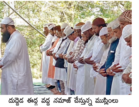
దుద్దిడ ఈర్ల వద్ద నమాజ్ చేస్తున్న మున్సిలరు

కొమురవెల్లి మండల పరిషత్లోని ఆయా గ్రామాల్లో శనివారం రంజాన్ పండుగను మున్సిలరు ఘనంగా జరుపుకున్నారు. ఈ సందర్భంగా ఆయా గ్రామాల్లో ప్రత్యేక ప్రార్థనలు నిర్వహించి ఒకరికొకరు అభింగనం చేసుకుంటూ శుభాకాంక్షలు తెలుపుకున్నారు. మండల పరిషత్లోని ఆయా గ్రామాల్లో సర్పంచులు, మాజీ ఎమ్మెల్యేలు మనీషులు వద్ద మున్సిలరు రంజాన్ శుభాకాంక్షలు తెలిపారు. అలాగే మండల పరిషత్లోని ఆయా గ్రామాల్లో సర్పంచులు, మాజీ ఎమ్మెల్యేలు మనీషులు వద్ద మున్సిలరు రంజాన్ శుభాకాంక్షలు తెలియజేశారు.