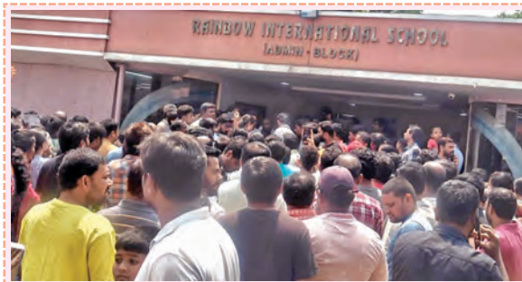
పాఠశాల ఎదుట ఆందోళన చేస్తున్న తల్లిదండ్రులు

అధిక ఫీజులు వసూలు చేస్తున్నారంటూ రెయిన్ బో స్కూల్ ఎదుట తల్లిదండ్రుల ఆందోళన అమీన్ పూర్, మార్చి 21, ప్రభాతవార్త: సంగారెడ్డి జిల్లా అమీన్ పూర్ లోని రెయిన్ బో పాఠశాల యాజమాన్యం అనుసరిస్తున్న తీరుపై విద్యార్థుల తల్లిదండ్రులు ఆందోళనకు దిగారు. పాఠశాల ఫీజులను ఇవ్వనివారితో పాఠశాలను అదుపు చేయమని, అదనపు ఖర్చుల పేరుతో తమపై భారం మోపుతున్నారని ఆగ్రహం వ్యక్తం చేస్తూ పాఠశాల గేటు ముందు శనివారం ధర్నా చేపట్టారు. స్కూల్ డ్రాస్టులు, ఎక్స్ట్రా మెటీరియల్స్, యాక్టివిటీ ఫీజుల పేరుతో యాజమాన్యం భారీగా డబ్బులు వసూలు చేస్తోందని తల్లిదండ్రులు మండి పడ్డారు. ప్రభుత్వ నిబంధనలకు విరుద్ధంగా, ఒక్కో విద్యార్థిని సుమారు రూ.20వేల వరకు ఫీజులు పెంచారని వారు ఆరోపించారు. పాఠశాల పాఠ్యపుస్తకాలు వాడుకోవడానికి అనుమతించకుండా, కచ్చితంగా కొత్తవే కొనాలని నిబంధనలు పెడుతున్నారని ఆవేదన వ్యక్తం చేశారు. బయట మార్కెట్లో రూ.150 నుండి రూ.200 వరకు లభించే పుస్తకాలను, స్కూల్లో రూ.400 వరకు అమ్ముతున్నారని తల్లిదండ్రులు పేర్కొన్నారు. ఆందోళన సమయంలో ట్రాన్సి పాల్ వచ్చి, ఈ విషయాన్ని యాజమాన్యం దృష్టికి తీసుకెళ్లాలని హామీ ఇచ్చారు. అయితే, తక్షణమే ఫీజులు తగ్గించకపోతే తమ పిల్లలకు డీసీలు ఇవ్వాలని, కామం చేరే పాఠశాలలకు చెల్లించుకుంటామని తల్లిదండ్రులు తెగసి వెచ్చారు. ఇప్పటికే జిల్లా విద్యాశాఖ అధికారికి విసతిపత్రం సమర్పించామని, ప్రభుత్వం స్పందించి ఫీజులను నియంత్రించాలని వారు డిమాండ్ చేస్తున్నారు. పాఠశాల నోటీసు బోర్డుపై ఎం తగ్గతికి ఎంత ఫీజు ఉందో స్పష్టంగా ప్రదర్శించాలని, పాఠశాలకు పాఠశాలని తల్లిదండ్రులు కోరుతున్నారు.