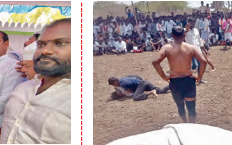
భేడ్లో కున్నీమ్ సవాల్.