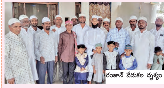
రంజాన్ వేడుకల దృశ్యం

చిలిపిచెడ, మార్చి 21, ప్రభాతవార్త : మండలం శ్రీరంగంపాటు పైజా బాద్ అజ్జుమి, బండ పోతుగల్, చిట్టెల్ల చందూర్, గొంతుగల్ గ్రామాల్లో శనివారం రంజాన్ వందనకు ముస్లింలు ఘనంగా జరుపుకున్నారు. ఈ సందర్భంగా ఈద్మాబాద్ ప్రత్యేక ప్రార్థనలు నిర్వహించి ఒకరికోకరు అలింగనం చేసుకుంటూ శుభాకాంక్షలు తెలుపుకున్నారు. ఆయా కార్యక్రమంలో ముస్లిం పెద్దలు, ఆయా పార్టీల, యువజన సంఘాల నాయకులు పాల్గొన్నారు.