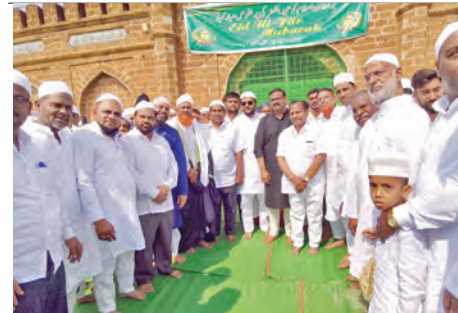
శుభాకాంక్షలు తెలుపుతున్న మాజీమంత్రి, సెటిన్స్ చైర్మన్