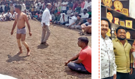
కాంగ్రెస్ జిల్లా కమిటీ సభ్యులను సన్మానిస్తున్న నేతలు