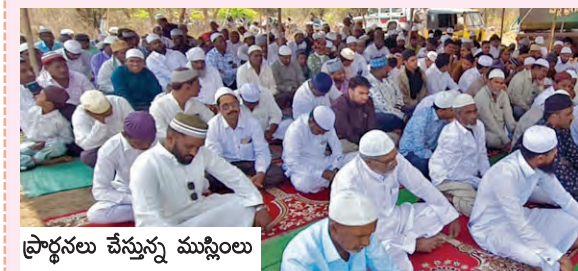
ప్రాధాన్యత చేస్తున్న ముస్లింలు