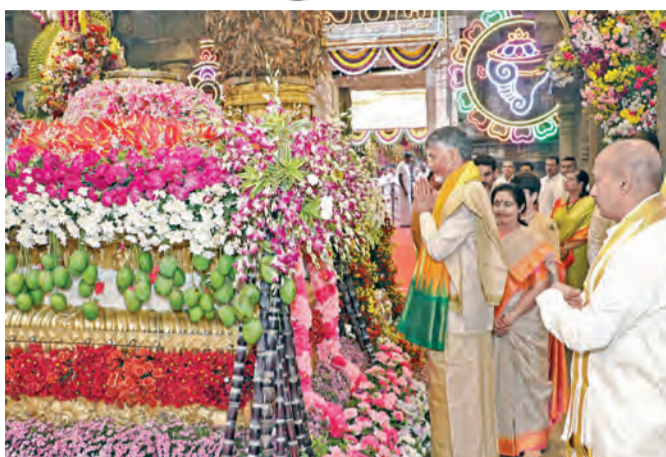
శనివారం శ్రీవారి ఆలయంలో ధ్వజస్తంభానికి మొక్కుతున్న సిఎం చంద్రబాబు దంపతులు

తిరుమలలో భక్తుల సౌకర్యాలను కమాండ్ కంట్రోల్ ద్వారా పర్యవేక్షించాలి అత్యాధునిక సిసి కెమెరాలు, ముఖగుర్తింపు వ్యవస్థను మెరుగుపరచాలి ఎటా ద్వారా మలగ్ని మెరుగైన చర్మలు: తిరుమలలో సిఎం చంద్రబాబు