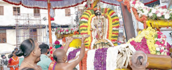
చంద్రబాబు ఆలయంలో ఆంధ్రజేతాను, సీఎం వారసులు అభినందించారు.

తిరుమల, మార్చి 21 ప్రభాతవార్త ప్రతినిధి: డి.డి.పి ఎన్నికల ప్రాణదాన క్రస్తుకు శనివారం దాత విరాళం ద్వారా 10 లక్షల రూపాయల విరాళం డి.డి.పి నాలుగు శనివారం ఉదయం 10 లక్షల రూపాయల విరాళం డి.డి.పి నాలుగు