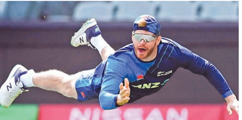
వచ్చేసిన ఫ్లయింగ్ మ్యాన్