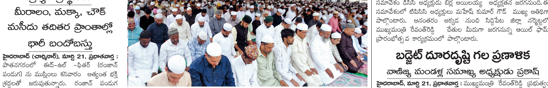
మీరాలం ఈడాలో జరిగిన ప్రత్యేక ప్రార్థనలో పాల్గొన్న ముస్లిం సోదరులు

మీరాలం, మక్కా, చౌక్ మసీదు తదితర ప్రాంతాల్లో భారీ బందోబస్తు