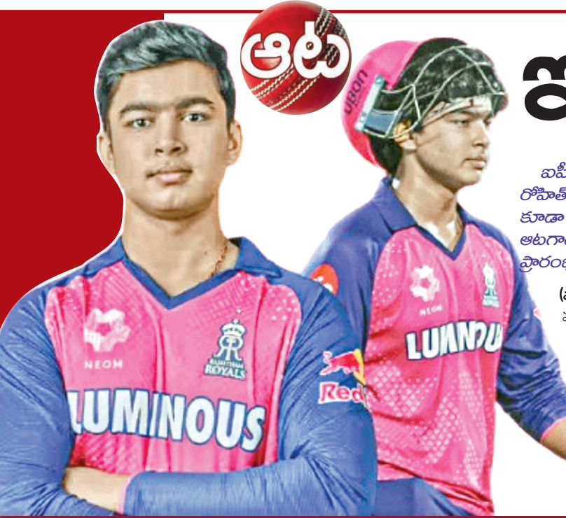
ఐపిఎల్ సెంటరాఫ్ అట్రాక్షన్ వైభవ్ సూర్యవంశీ