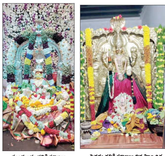
సుంకులమ్మతల్లికి పూజలు నిర్వహించిన దృశ్యం | పెద్దమ్మతల్లికి పూజలు నిర్వహించిన దృశ్యం