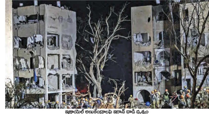
ఇజ్రాయెల్ అణుకేంద్రాలపై ఇర్రాన్ దాడి దృశ్యం

టెహ్రాన్, జెరూసలేం, వాషింగ్టన్, మార్చి 22: మధ్యప్రాచ్యంలో ఉద్ధృతం అవుతున్న యుద్ధం ప్రపంచదేశాలను కలవరపరుస్తోంది. ఇరాన్ తన ఖదాంజాలో క్షిపణులతో కొనసాగుస్తున్న దాడులు అమెరికాను సైతం కలవరపెడుతున్నాయి. డిగ్రోగ్గాయలోని యుఎస్ బేసెల్పై దాడి >>2