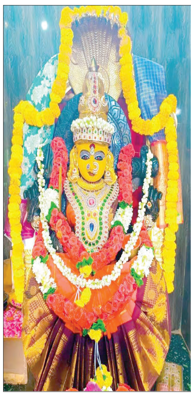
ప్రత్యేక అలంకరణలో గంగమ్మతల్లి