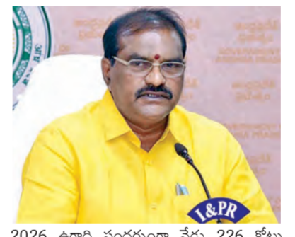
2026 ఊది సందర్భంగా నేడు 226 కోట్ల వెల 1940 కోట్లు నిర్మాణాలకు ఖాతాలో జమ చేయించిన జరిగిందన్నారు. పోలవరం ప్రాజెక్టుకి 2014-19 తెలుగుదేశం హయాంలో కేంద్ర నిధులు సహాయంతో రాకపోయినా అప్పటి తెలుగు దేశం ప్రభుత్వం రాష్ట్ర బడ్జెట్ నుంచి పెద్ద మొత్తంలో నిధులు కేటాయింది, వసూలు సాగించి >>2

జలవనరుల మంత్రి నిమ్మల విజయవాడ మార్చి 22 ప్రభాతవార్త ప్రతినది: 2027 నాటికి పోలవరం పూర్తి చేసే దిశగా శరవేగంగా పనులు జరుగుతున్నాయని రాష్ట్ర జలవనరుల శాఖ మంత్రి నిమ్మల రామనాయుడు అన్నారు. పోలవరం పూర్తయ్యే లోపగానే నిర్మాణాలకు పునరావాసం, పరిహారం చెల్లించే విధంగా ప్రజా ఫిరకత్ పని చేస్తున్నామన్నారు. 2014-19లో చంద్రబాబు ముఖ్యమంత్రి ఉండగానే 700 కోట్ల రూపాయలు నిర్మాణాలకు అందజేసిన విషయాన్ని గుర్తించారు. మళ్లీ ఇప్పుడు కూడా ప్రభుత్వం అధికారంలోకి వచ్చిన తర్వాత, గడిచిన 21 నెలల్లో 1940 కోట్లు నిర్మాణాలకు అంజనం చేసి, వారికి అందగా నిలిచిన పునరీ చంద్రబాబు నాయుడికి దక్కకుండా ఉన్నాయి. 2025 సంవత్సరానికి 800 కోట్లు దీపావళి 914 కోట్లు, >>2