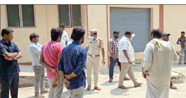
మాల్వరీ వద్ద గుమిగూడిన బాధితులు