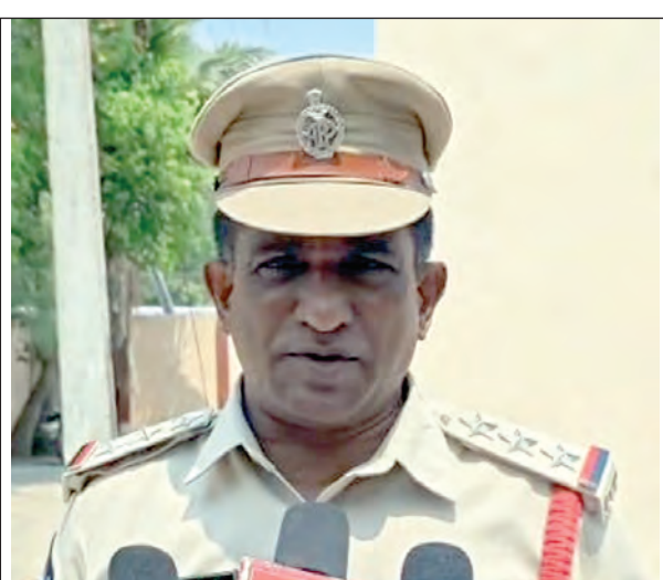
హత్య జరిగిన తీరును మీడియాకు తెలుపుతున్న సీబి