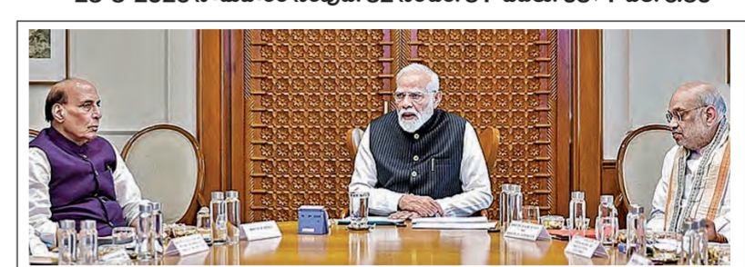
ఆదివారం కేబినెట్ భేటీలో పాల్గొన్న ప్రధాని మోడీ. చిత్రంలో కేంద్రమంత్రిలు, రాజీనాథ్, అమిత్ షా

30యేళ్ల క్రితమే ఐటీ రంగాన్ని అభివృద్ధి చేశా ఎపిలో 15% వృద్ధిరేటు సాధించాం విశాఖకు గూగుల్ డేటా సెంటర్ వస్తోంది హైదరాబాద్ ను గ్లోబల్ సిటీగా మార్చడానికి ఎంతోకష్టపడ్డా ఐఎన్ టెక్ సమ్మిట్ లో సీఎం చంద్రబాబు