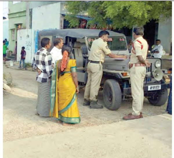
వివరాలు తెలుసుకుంటున్న ఎస్ఐ