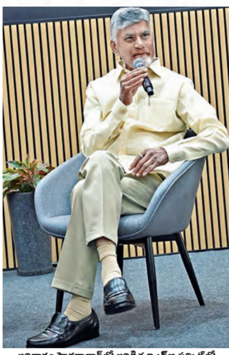
ఆదివారం హైదరాబాద్ లో జరిగిన ఐఎన్ టెక్ సమ్మిట్ లో ప్రసంగిస్తున్న సీఎం చంద్రబాబు

హైదరాబాద్ (గృహశాఖ), మార్చి 22 ప్రభాతవార్త: నేడు ప్రపంచం ఏను, క్యాంటం కంప్యూటింగ్, స్పెస్ టెక్నాలజీ దిశగా అడుగులు వేస్తుంది. డ్రోన్, ఎయిర్ ఆంటెనెస్టుల విస్తరణ వేగంగా జరుగుతుంది. ఆంధ్రప్రదేశ్ రాష్ట్ర ముఖ్యమంత్రి నారా చంద్రబాబు నాయుడు అన్నారు. హైదరాబాద్ ను గ్లోబల్ సిటీగా మార్చడంలో తాము ఎంతో కష్టపడ్డామని కీలక వ్యాఖ్యలు చేశారు. గృహశాఖలోని ఇండియాన్ స్కూల్ ఆఫ్ టెక్నాలజీ (ఐఎన్ టెక్)లో నిర్వహిస్తున్న సౌత్ ఏషియా రెగియన్ సమ్మిట్లో ఆదివారం చంద్రబాబు నాయుడు ముఖ్యఅతిథిగా హాజరయ్యారు. ఈ సందర్భంగా ఆయన భవిష్యత్తు సాంకేతికత, ఏటా వినియోగం, డేటా భద్రతలు మాట్లాడుతూ ఐటీ రంగం ప్రాముఖ్యతను గుర్తించిన తాము 30 ఏళ్ల క్రితమే ఐటీ రంగం మీద దృష్టి కేంద్రీకరించామని అన్నారు. నేడు డ్రోన్ టెక్నాలజీ అత్యధిక ప్రాధాన్యత ఉందని, ప్రస్తుత యుద్ధాల్లో డ్రోన్ టెక్నాలజీని ప్రపంచం గమనిస్తుందన్నారు. ప్రపంచం దృష్టిని ఆకర్షించేలా డేటా సెంటర్లు, పాస్ వైర్ లాస్ రూపొందించే డ్యాటా ఆంధ్రప్రదేశ్ ను అగ్రస్థానంలో నిలుపుతామన్నారు. విద్యుత్ సంక్షోభం నుంచి మిగులు విద్యుత్ సాధించే విధంగా నేడు ఆంధ్రప్రదేశ్ రాష్ట్రం పయనించింది, ప్రస్తుతం గ్రీన్ ఎనర్జీ, వింగ్, సోలార్ విద్యుత్ రంగాలను ప్రోత్సహిస్తున్నామన్నారు. గ్రీన్ ఎనర్జీ వినియోగంలో దక్షిణ భారత్ లోనే ఆంధ్రప్రదేశ్ అగ్రగామిగా ఉందన్నారు. 2014 నుంచి 2019 మధ్య ఆంధ్రప్రదేశ్ రాష్ట్రంలో ఎన్నో సంస్కరణలు తీసుకు వచ్చామని, నేడు మరోసారి అభివృద్ధి, సంక్షేమాలను ముందుకు తీసుకువెళ్తున్నట్లు తెలిపారు. ఆంధ్ర ప్రదేశ్ రాష్ట్రాన్ని దేశంలోనే అగ్ర స్థాయి ఆర్థికవ్యవస్థగా తీర్చిదిద్దేలా విజన్ దాకవ్వమంటే >>2