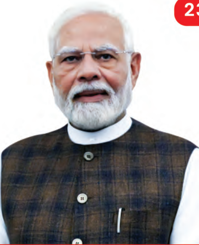
శ్రీ నరేంద్ర మోదీ గౌరవ భారత ప్రధాని