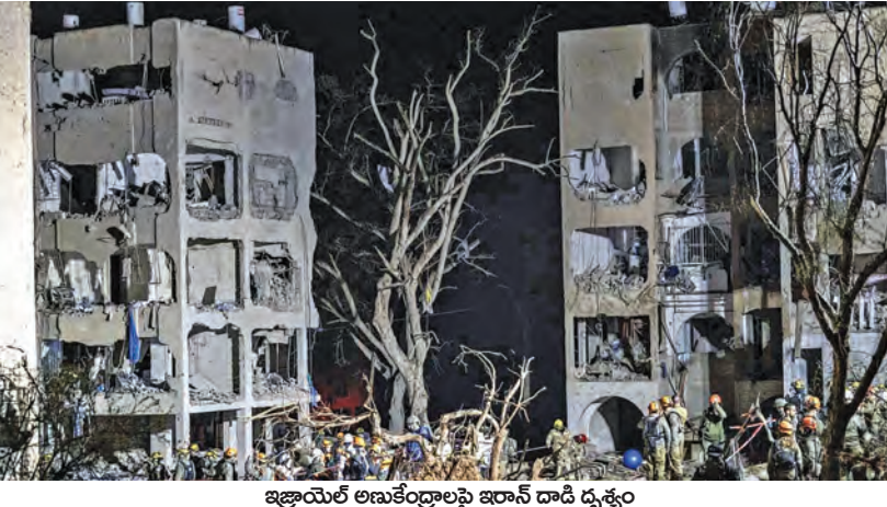
ఇజ్రాయెల్ అణుకేంద్రాలపై ఇరాన్ దాడి దృశ్యం

టెహ్రాన్, జెరూసలేం, వాషింగ్టన్, మార్చి 22: మధ్యప్రాచ్యంలో ఉద్ధృతం అవుతున్న యుద్ధం ప్రపంచదేశాలను కలవరపరుస్తోంది. ఇరాన్ తన ఖదాంతర క్షిపణులతో కొనసాగిస్తున్న దాడులు అమెరికాను సైతం కలవరపెడుతున్నాయి. డిగోగార్మియోలోని యుఎస్ జేసెల్పై దాడి