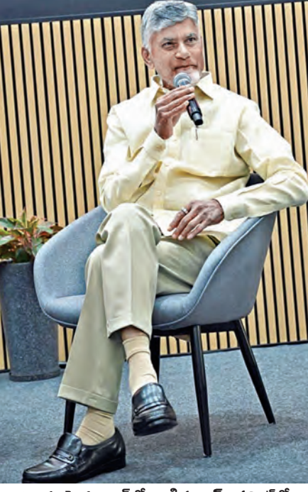
ఆదివారం హైదరాబాద్ లో జరిగిన ఐఎస్బి సమ్మిట్ లో ప్రసంగిస్తున్న సీఎం చంద్రబాబు

హైదరాబాద్(గోబుల్), మార్చి 22 ప్రభాతవార్త: నేడు ప్రపంచం ఏ.బి. క్యాంటం కంప్యూటింగ్, స్పేస్ టెక్నాలజీ దిశగా అడుగులు వేస్తుందని, డ్రోన్లు, ఎయిర్ ఆటోమోటివ్ లు విస్తరణ వేగంగా జరుగుతున్నాయని ఆంధ్రప్రదేశ్ రాష్ట్ర ముఖ్యమంత్రి నారా చంద్రబాబు నాయుడు అన్నారు. హైదరాబాద్ ను గ్లోబల్ సిటీగా మార్చడంలో తాము ఎంతో కట్టవద్దామని కీలక వ్యాఖ్యలు చేశారు. గచ్చిబౌలిలోని ఇండియాన్ స్పాకెట్ ఆఫ్ బిజినెస్(ఐఎస్బి)లో నిర్వహిస్తున్న సాత్ ఏషియా లెగ్సింగ్ సమ్మిట్లో ఆదివారం చంద్రబాబు నాయుడు ముఖ్యఅతిథిగా హాజరయ్యారు. ఈ సందర్భంగా ఆయన భవిష్యత్తు సాంకేతికత, ఏవ మినయోగం, డేటా భద్రతలకు చూడటం వంటి రంగం ప్రాముఖ్యతను గుర్తించిన తాము 30 ఏళ్ల క్రితమే ఐటీ రంగం మీద దృష్టి కేంద్రీకరించామని అన్నారు. నేడు డ్రోన్ టెక్నాలజీ అత్యధిక ప్రాధాన్యత ఉందని, ప్రస్తుత యుద్ధాల్లో డ్రోన్ టెక్నాలజీని ప్రపంచం గమనిస్తున్నదన్నారు. ప్రపంచం దృష్టిని ఆకర్షించేలా డేటా సెంటర్లు, పాలిటెక్నాలజీలు చేపట్టడం ద్వారా ఆంధ్రప్రదేశ్ ను అగ్రస్థానంలో నిలుపుతామన్నారు. విద్యుత్ సంక్షోభం నుంచి మిగులు విద్యుత్ సాధించే విధంగా నేడు ఆంధ్రప్రదేశ్ రాష్ట్రం పయనించిందని, ప్రస్తుతం గ్రీన్ పవర్, వింగ్, సోలార్ విద్యుత్ రంగం గాను ప్రోత్సహిస్తున్నామన్నారు. గ్రీన్ ఎనర్జీ మినయోగంలో దక్షిణ భారత్ లోనే ఆంధ్రప్రదేశ్ అగ్రగామిగా ఉండవచ్చు. 2014 నుంచి 2019 మధ్య ఆంధ్రప్రదేశ్ రాష్ట్రంలో ఎన్నో సంస్కరణలు తీసుకు తీసుకువచ్చినట్లు తెలిపారు. ఆంధ్ర ప్రదేశ్ రాష్ట్రాన్ని దేశంలోనే అగ్ర స్థాయి ఆర్థికవ్యవస్థగా తీర్చిదిద్దాలి విజన్ దాకట్టుమోడల్