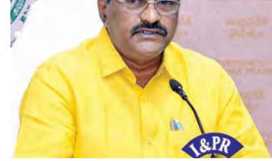
2026 ఊది సందర్భంగా నేడు 226 కోట్లు వెనెసి 1940 కోట్లు నిర్మాణానికి భారత్ జమ చేయడం జరిగిందన్నారు. పోలవరం ప్రాజెక్టుకి 2014-19 తెలుగుదేశం హయాంలో కేంద్ర నిధులు సకాలంలో రాకపోయినా అప్పటి తెలుగు దేశం ప్రభుత్వం రాష్ట్ర బడ్జెట్ నుంచి పెద్ద మొత్తంలో నిధులు కేటాయింది, పనులు సాగించి

జలవనరుల మంత్రి నిమ్మల విజయవాడ మార్చి 22 ప్రభాతవార్త ప్రతినిధి: 2027 నాటికి పోలవరం పూర్తి చేసే దిశగా శరవేగంగా పనులు జరుగుతున్నాయని రాష్ట్ర జలవనరుల శాఖ మంత్రి నిమ్మల రామానాయుడు అన్నారు. పోలవరం పూర్తయ్యే లోపుగానే నిర్మాణానికి పునరావాసం, పరిహారం చెల్లించే విధంగా ప్రణాళిక వని చేస్తున్నామన్నారు. 2014-19లో చంద్రబాబు ముఖ్యమంత్రి ఉండగానే 700 కోట్ల రూపాయలు నిర్మాణానికి అందజేసిన విషయాన్ని గుర్తించారు. మళ్లీ ఇప్పుడు కూడా మి ప్రభుత్వం అధికారంలోకి వచ్చిన తర్వాత, గడిచిన 21వేలలో 1940 కోట్లు నిర్మాణానికి అందజేసి, వారికి అందగా నిలిచిన ఘనత చంద్రబాబు నాయుడికి దక్కుతుందన్నారు. 2025 సంవత్సరానికి 800 కోట్లు డివైపీ 914 కోట్లు