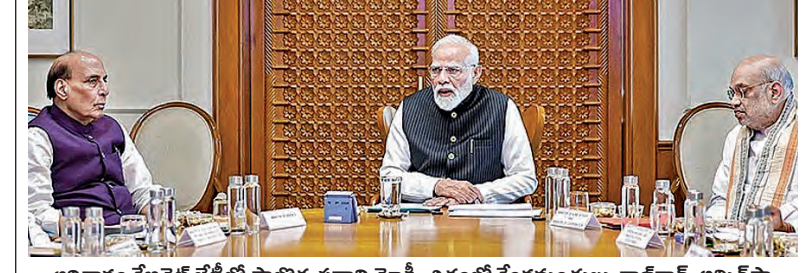
ఆదివారం కేబినెట్ భేటీలో పాల్గొన్న ప్రధాని మోడీ. చిత్రంలో కేంద్రమంత్రులు, రాజీవ్ గాంధీ, అమిత్ షా

30యేళ్ల క్రితమే ఐటీ రంగాన్ని అభివృద్ధి చేశా ఎపిలో 15% వృద్ధిరేటు సాధించాం విశాఖకు గూగుల్ డేటా సెంటర్ వస్తోంది హైదరాబాద్ ను గ్లోబల్ సిటీగా మార్చడానికి ఎంతోకష్టపడ్డా ఐఎన్ఐ సమ్మిట్ లో సీఎం చంద్రబాబు