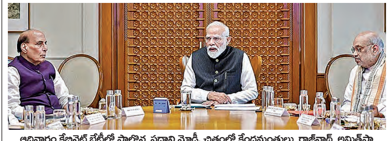
ఆదివారం కేబినెట్ భేటీలో పాల్గొన్న ప్రధాని మోడీ. చిత్రంలో కేంద్రమంత్రిలు, రాజీనాథ్, లమకేష్

30 ఏళ్ల క్రితమే ఇటీవల రంగాన్ని అభివృద్ధి చేశాం ఎపిలో 15% వృద్ధిరేటు సాధించాం విశాఖకు గూగుల్ డేటా సెంటర్ వస్తోంది హైదరాబాద్ ను గోల్కొండగా మార్చడానికి ఎంతోకష్టపడ్డాం ఐఎన్ బి సమ్మిట్ లో సీఎం చంద్రబాబు