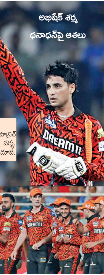
డాన్ జట్టు ఈసారి ఆశాజనకంగా కనిపిస్తోంది. టాప్ ఆర్డర్ ఫామ్ కోసం సాగిస్తున్న జట్టు విజయం సాధించడం కష్టమే కాదు.