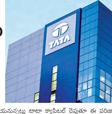
టాటా క్యాపిటల్ కు 413 కోట్ల పన్ను నోటీసులు