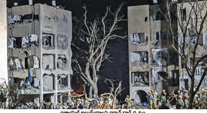
ఇజ్రాయెల్ అణుకేంద్రాలపై ఇరాన్ దాడి దృశ్యం

టెహ్రాన్, జెరూసలేం, వాషింగ్టన్, మార్చి 22: మధ్యప్రాంతంలో ఉద్బవం అవుతున్న యుద్ధం ప్రపంచదేశాలను కలవరపరుస్తోంది. ఇరాన్ తన ఖదాంతర క్షిప్రణులతో కొనసాగుతున్న దాడులు అమెరికాను సైతం కలవరపెడుతున్నాయి. డిగ్ గార్నియోలోని యుఎస్ జెనెర్లై దాడి