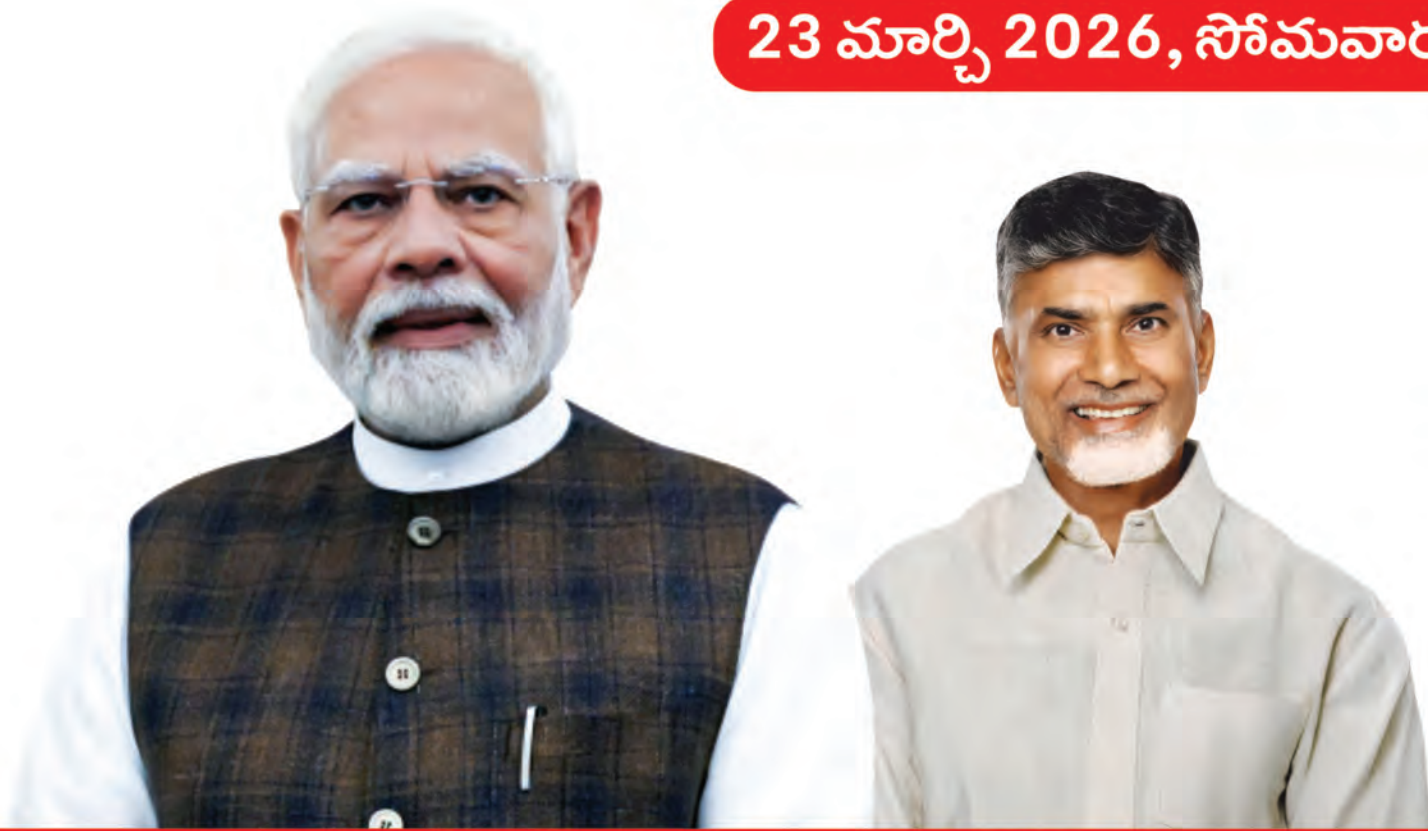
శ్రీ నరేంద్ర మోదీ గౌరవ భారత ప్రధాని