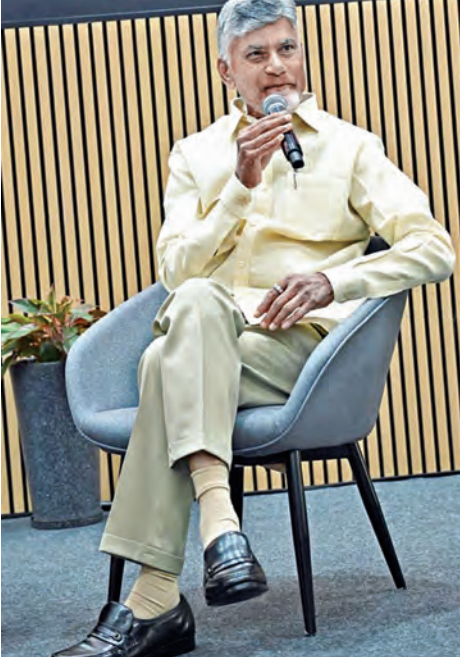
ఆదివారం హైదరాబాద్ లో జరిగిన ఎస్ బి సమీక్షలో ప్రసంగిస్తున్న సీఎం చంద్రబాబు

హైదరాబాద్ (గజ్వీల్), మార్చి 22 ప్రభాతవార్త: నేడు ప్రపంచం ఏదో, క్యాంటం కంప్యూటర్, స్పెస్ బెక్కలజీ దిశగా అడుగులు వేస్తుంది. ప్రోసెసర్, ఎయిర్ అంబులెన్సుల విస్తరణ వేగంగా జరుగుతుంది ఆంధ్రప్రదేశ్ రాష్ట్ర ముఖ్యమంత్రి నారా చంద్రబాబు నాయుడు అన్నారు. హైదరాబాద్ నుండి గోల్కొండ వరకు మార్గంలో తాము ఎంతో కష్టపడ్డామని కీలక వ్యాఖ్యలు చేశారు. గజ్వీల్ లోని ఇండియన్ స్కూల్ ఆఫ్ బిజినెస్ (ఎస్ బి)లో నిర్వహిస్తున్న సౌత్ ఏషియా లెగిస్లేషన్ సమీక్షలో ఆదివారం చంద్రబాబు నాయుడు ముఖ్యఅతిథిగా పాల్గొన్నారు. ఈ సందర్భంగా ఆయన భవిష్యత్తు సాంకేతికత, ఏదో వినియోగం, డేటా భద్రతపై మాట్లాడుతూ ఇటీవల రంగం ప్రాముఖ్యతను గుర్తించిన తాము 30 ఏళ్ల క్రితమే ఇటీవల రంగం మీద దృష్టి కేంద్రీకరించామని అన్నారు. నేడు ప్రోసెసర్ బెక్కలజీ అత్యధిక ప్రాధాన్యత ఉందని, ప్రస్తుత యుద్ధాల్లో ప్రోసెసర్ బెక్కలజీని ప్రపంచం గమనిస్తుందన్నారు. ప్రపంచం దృష్టిని ఆకర్షించేలా డేటా సెంటర్లు, పాలిటెక్నిక్ రూపకల్పన చేపట్టడం ద్వారా ఆంధ్రప్రదేశ్ను అగ్రస్థానంలో నిలుపుతామన్నారు. విద్యుత్ సంక్షోభం నుంచి మిగులు విద్యుత్ సాధించే విధంగా నేడు ఆంధ్రప్రదేశ్ రాష్ట్రం పయనించింది, ప్రస్తుతం గ్రీన్ ఎనర్జీ, వీగ్, సోలార్ విద్యుత్ రంగం గాను ప్రోత్సహిస్తున్నామన్నారు. గ్రీన్ ఎనర్జీ వినియోగంలో దక్షిణ భారత్ లోనే ఆంధ్రప్రదేశ్ అగ్రామిగా ఉందన్నారు. 2014 నుంచి 2019 మధ్య ఆంధ్రప్రదేశ్ రాష్ట్రంలో ఎన్నో సంస్కరణలు తీసుకు వచ్చామని, నేడు మరోసారి అభివృద్ధి, సంక్షేమాలను ముందుకు తీసుకువెళ్తున్నట్లు తెలిపారు. ఆంధ్ర ప్రదేశ్ రాష్ట్రాన్ని దేశంలోనే అగ్ర స్థాయి ఆర్థికవ్యవస్థగా తీర్చిదిద్దడానికి విజన్ డాక్యుమెంట్