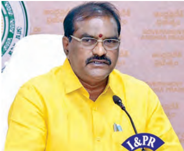
2026 డిసెంబరు నెలలో పూర్తి చేసే 226 కోట్ల వెరసి 1940 కోట్ల నిర్వాసితుల భారాల్లో జమ చేయడం జరిగిందన్నారు. పోలవరం ప్రాజెక్టుకి 2014-19 తెలుగుదేశం హయాంలో కేంద్ర నిధులు సహకారం లోకేష్ హయాంలో తెలుగుదేశం ప్రభుత్వం రాష్ట్ర బడ్జెట్ నుంచి పెద్ద మొత్తం లో నిధులు కేటాయించి, పనులు సాగించి

జలవనరుల మంత్రి నిమ్మల విజయవాడ మార్చి 22 ప్రభాతవార్త ప్రతినది: 2027 నాటికి పోలవరం పూర్తి చేసే దిశగా శరవేగంగా పనులు జరుగుతున్నాయని రాష్ట్ర జలవనరుల శాఖ మంత్రి నిమ్మల రామానాయుడు అన్నారు. పోలవరం పూర్తయ్యే లోపుగానే నిర్వాసితులకు పునరావాసం, పరిపరం చెల్లింపే విధంగా ప్రజా శిక్షణ పని చేస్తున్నామన్నారు. 2014-19లో చంద్రబాబు ముఖ్యమంత్రి ఉండగానే 700 కోట్ల రూపాయలు నిర్వాసితులకు అందజేసిన విషయాన్ని గుర్తుచేశారు. మళ్లీ ఇప్పుడు కూడా ప్రభుత్వం అధికారంలోకి వచ్చిన తర్వాత, గడిచిన 21 నెలల్లో 1940 కోట్ల నిర్వాసితులకు అందజేసి, వారికి అందగా నిలిచిన ఘనత చంద్రబాబు నాయుడికి దక్కతుందన్నారు. 2025 గౌరవస్థా ప్రభుత్వం ఈ నిర్ణయం తీసుకుంది. జలవనరుల మంత్రి నిమ్మల విజయవాడ మార్చి 22 ప్రభాతవార్త ప్రతినది: 2027 నాటికి పోలవరం పూర్తి చేసే దిశగా శరవేగంగా పనులు జరుగుతున్నాయని రాష్ట్ర జలవనరుల శాఖ మంత్రి నిమ్మల రామానాయుడు అన్నారు. పోలవరం పూర్తయ్యే లోపుగానే నిర్వాసితులకు పునరావాసం, పరిపరం చెల్లింపే విధంగా ప్రజా శిక్షణ పని చేస్తున్నామన్నారు. 2014-19లో చంద్రబాబు ముఖ్యమంత్రి ఉండగానే 700 కోట్ల రూపాయలు నిర్వాసితులకు అందజేసిన విషయాన్ని గుర్తుచేశారు. మళ్లీ ఇప్పుడు కూడా ప్రభుత్వం అధికారంలోకి వచ్చిన తర్వాత, గడిచిన 21 నెలల్లో 1940 కోట్ల నిర్వాసితులకు అందజేసి, వారికి అందగా నిలిచిన ఘనత చంద్రబాబు నాయుడికి దక్కతుందన్నారు. 2025 గౌరవస్థా ప్రభుత్వం ఈ నిర్ణయం తీసుకుంది.