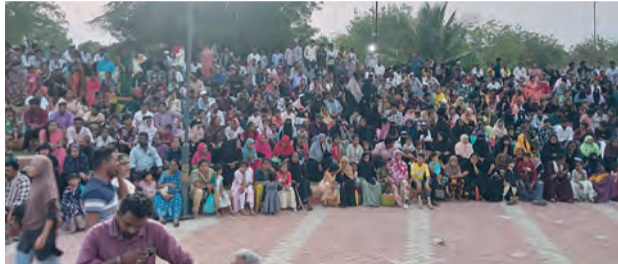
పెద్ద ఎత్తున హాజరైన ప్రజాసేవ కేంద్రం