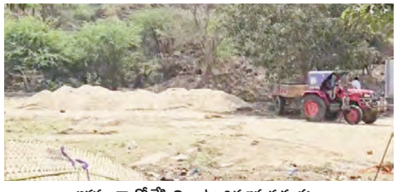
అక్రమంగా దోచిన నిల్వ ఉంచిన ఇసుక డంపులు