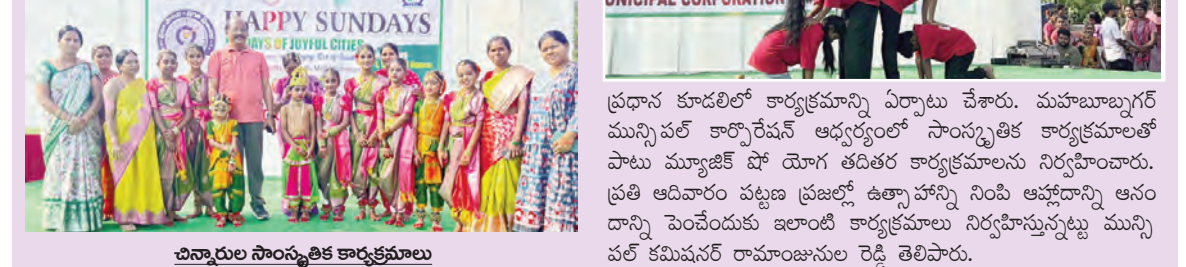
చిన్నారుల సాంస్కృతిక కార్యక్రమాలు

ఉత్సాహంగా గడిపిన పట్టణ ప్రజలు, ఆది పాడిన చిన్నారులు, పెద్దలు మహబూబ్ నగర్, మార్చి 22 ప్రభాతవార్త: మహబూబ్ నగర్ మున్సిపల్ కార్పొరేషన్ హ్యాపీ సండే కార్యక్రమాన్ని ఉత్సాహంగా నిర్వహించారు. 99 రోజుల ప్రజా పాలన ప్రగతి ప్రజాశాసన కార్యక్రమంలో భాగంగా ఆదివారం ఉదయం మహబూబ్ నగర్ స్టేడియం కమాన్, కొత్త బస్టాండ్