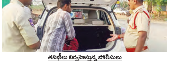
ఆసఫీలు నిర్వహిస్తున్న పోలీసులు