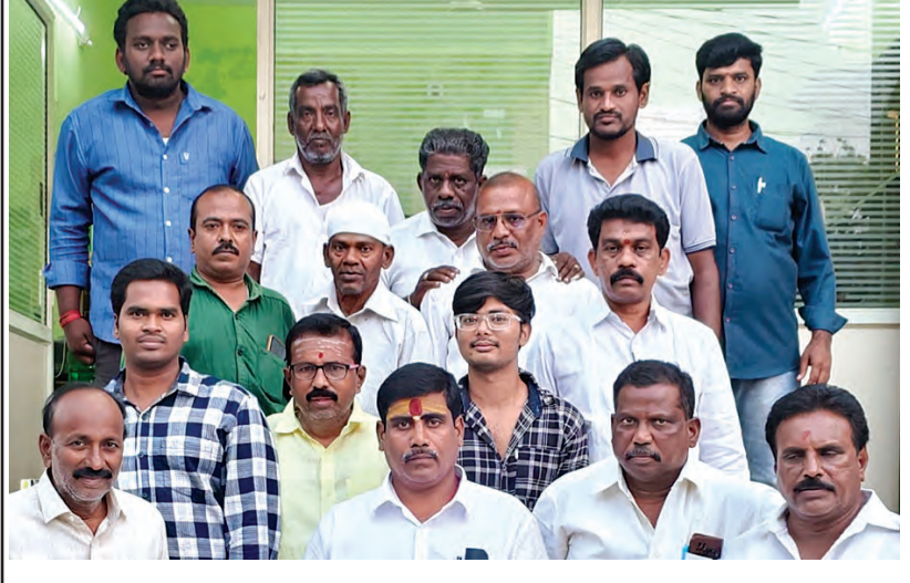
శ్రీకాళహస్తి, మార్చి 22 ప్రభాతవార్త