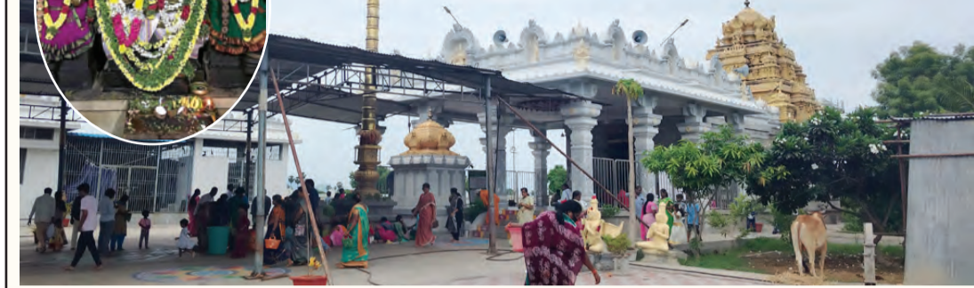
తొండమాన్ పురం ఆలయం, పెరుమాళ్ స్వామి