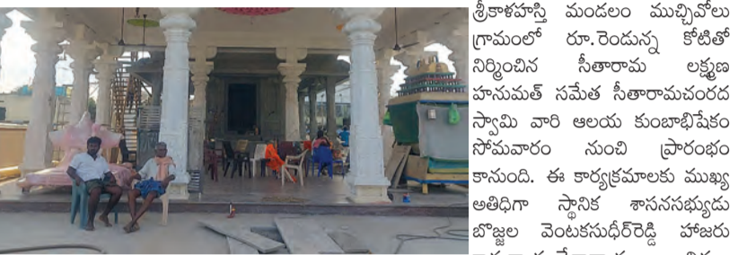
శ్రీకాళహస్తి, మార్చి 22 ప్రభాతవార్త