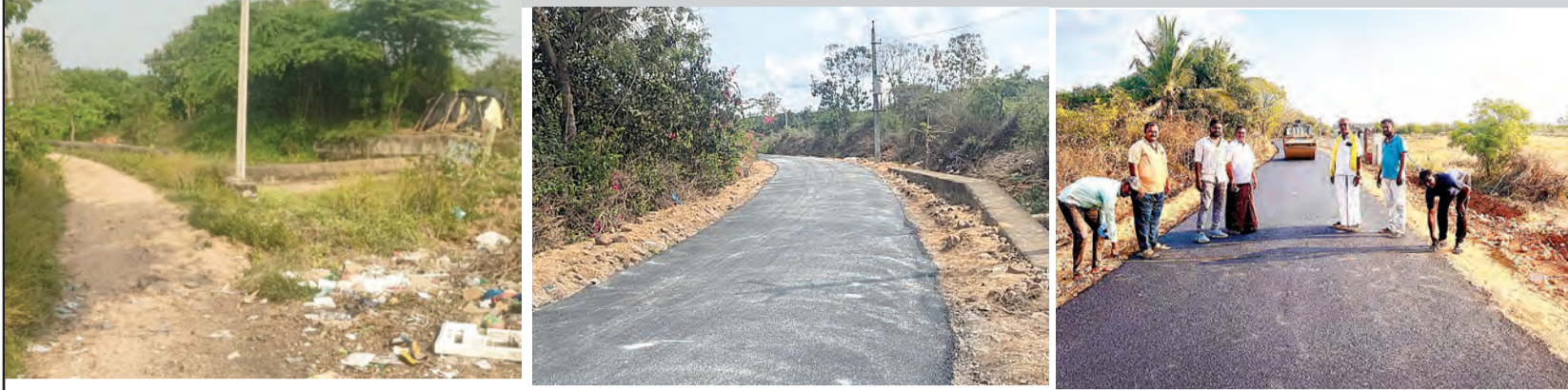
విజయపురం, మార్చి 22 ప్రభాతవార్త:

మండలంలోని పలు గ్రామీణ రోడ్లు ఏళ్లు తరబడి మట్టి రోడ్లుగా గుంతలమయమై రాకపోకలకు వాహనదారులు, సాధారణ ప్రజలు ఇబ్బందులు పడేవారు. గతంలో ఎన్నో ప్రభుత్వాలూ అధికారానికి వచ్చిపోయాయి. అంతేకాకుండా ఈ నియోజకవర్గంలో ఇద్దరు మంత్రులుగా కూడా పనిచేశారు. ఈ రోడ్ల దుస్థితి అలాగే వదిలేశారు. ప్రస్తుత ఎమ్మెల్యే గాలి భానుప్రకాశ్ చరణతో మండలంలోని పలు మట్టి రోడ్లను తారు రోడ్లుగా మార్చేందుకు సుమారు 8 కోట్ల ఎస్ఆర్కేజీఎస్ నిధులు మంజూరు చేయించి త్వరితగతిన పనులు చేపట్టి పూర్తి చేయించారు. ఇందులో భాగంగా కోనలనగరం మిట్టూరు,