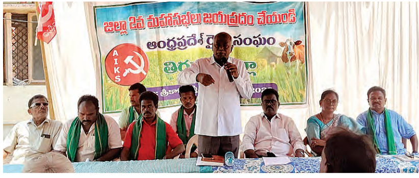
శ్రీకాళహస్తి, మార్చి 22 ప్రభాతవార్త