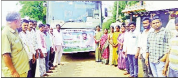
విడుదల చేయడం జరుగుతుంది. ఈ కార్యక్రమానికి మండలంలో ఉన్నటువంటి రైతులు మహిళా సంఘాలు ప్రజా పనిళ్లు వ్యవసాయ అధికారులు పాల్గొనడం జరిగింది.

ముఖ్యమంత్రివర్యులు గారు చేతుల మీదుగా ఆయిల్ ఫామ్ ఫ్యాక్టరీని ప్రారంభం చేయమన్నారు, దీనికిగాను మండలం నుంచి సుమారుగా 250 మంది రైతులు నర్సేట్ల గ్రామం, సిద్దిపేట జిల్లా కు బయలుదేరడం జరిగింది. ఈ కార్యక్రమంలో గట్టుకల్లు గ్రామ సర్పంచ్ చెప్పి కాశి రైతులతో కలిసి బస్సులో బయల్దేరడం జరిగింది. మహోత్సవం కార్యక్రమంలో భాగంగా రైతులను ఉద్దేశిస్తూ రాష్ట్ర ప్రభుత్వం ప్రవేశపెడుతున్నటువంటి పథకాల గురించి తెలియజేస్తూ మరియు ఆల్ ఆయిల్ ఫామ్ రైతులను ప్రోత్సహిస్తూ వారికి అన్ని విధాలుగా అందుబాటులో ఉండే విధంగా ఆయిల్ ఫ్యాక్టరీని ప్రారంభించడం జరుగుతుంది. మరియు రైతులకు పంట పెట్టుబడి సహాయం నిధి కూడా రైతు భరోసాను గౌరవ ముఖ్యమంత్రి చేతుల మీదుగా