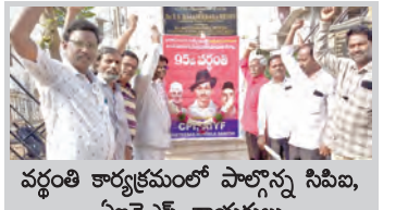
వర్ధంతి కార్యక్రమంలో పాల్గొన్న సీపీఐ, ఎఐఎస్ఎస్ నాయకులు