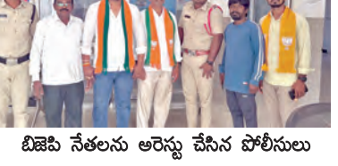
బిజెపి నేతలను అరెస్టు చేసిన పోలీసులు