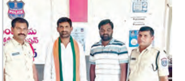
సందిగం బిజెపి నాయకులను ఆరెస్టు చేసిన పోలీసులు