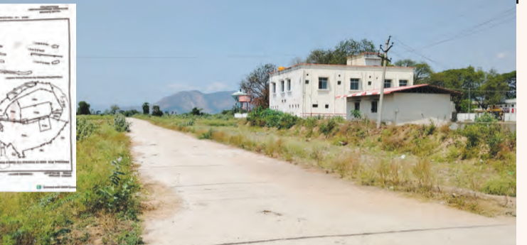
ఆలయ భూముల అవకాశం నిర్మించిన సీమెంటు, ఆలయ పరిసరాల స్కేచ్

దేవస్థానం అప్పగించారు. టిటిడి జక్కడ నిత్యవైష్ణవ వైష్ణవాలను నిర్వహిస్తున్నారు. ఆ ఆలయానికి సంబంధించి కోటగట్టు, అగ్రాలు, రెడ్డి గంటలన్నాయి వారిని కాపాడాలని ప్రజా వేదిక స్పందన కార్యక్రమంలో 07.04.2025లో కలెక్టర్ కు ఫిర్యాదు చేశారు. ఆ ఆస్తిని పరిశీలించటంకు 70 రోజుల సమయం కోరి తరువాత ఓ ప్రవేటు వ్యక్తికి 26.04.2025న కన్వర్షన్ దారి లేని భూములకు దారి అవకాశం కల్పించారు. కలెక్టర్ ఖాతాలో ఉన్న భూములను కలెక్టర్ ఉత్తర్వులు లేకుండా గ్రామ సర్పంచ్ అనుమతిపైనే మేరకు ఆర్డీ. ధారాదత్తం చేసినట్లు ఫిర్యాదులో పేర్కొన్నారు. మళ్ళీ గ్రామానికి వేదించిన వ్యక్తి స్పందన కార్యక్రమంలో కలెక్టర్ కు 30.06.2025న ఫిర్యాదు చేస్తూ తనకేమో తన ఆర్డీ మీద వివరాలు 70 రోజుల వ్యవస్థ కోసం రెవెన్యూ శాఖ ప్రైవేటు వ్యక్తికి ధారాదత్తం చేశారు. ఈ అంశానికి సంబంధించి 24.11.2025న స్పందనలో మరో సారి కలెక్టర్ కు అందించారు. ప్రజావేదిక, స్పందన ఎందుకు? ప్రభుత్వం మహోన్నత లక్ష్యంతో రెవెన్యూ సమస్యలు ఎక్కడికక్కడ పరిష్కరించాలనే మహోన్నత లక్ష్యంతో ఏర్పాటు చేసింది. అయితే ఈ వేదికలో అందుతున్న సమస్యలను ఎంత వరకు పరిష్కరించబడుతున్నాయో ప్రశ్నార్థకంగా మారింది. ఇందుకు నిదర్శనం తొండమాన్ భూముల వివాదాలు. సాక్షాత్తు కలెక్టర్ ఖాతాలో ఉన్న భూములను పరిశీలించాల్సిన బాధ్యత రెవెన్యూ అధికారులది కాదా? మరి ఎందుకు ఫిర్యాదు అందిన తరువాత ఈ భూములకు కన్వర్షన్ ఇచ్చారు. రెవెన్యూ శాఖపై ఎవరి వత్తిడి అయినా పడినా? లేక ఫిర్యాదుల మీద లెక్కలేని తనమా? అనే విషయాల చోటు చేసుకున్నాయి. ఇప్పటికైనా రెవెన్యూ అధికారులు, కలెక్టర్ స్పందించి కలియని దైవం ఆస్తిని పరిశీలించే లేక ఏ ముందరే అంటూ గాలికి వదిలిపెడతాలో వేచి చూచాలి! (రేటికే సంకలనం టిటిడి ఎందుకు స్పందించటం లేదు?)