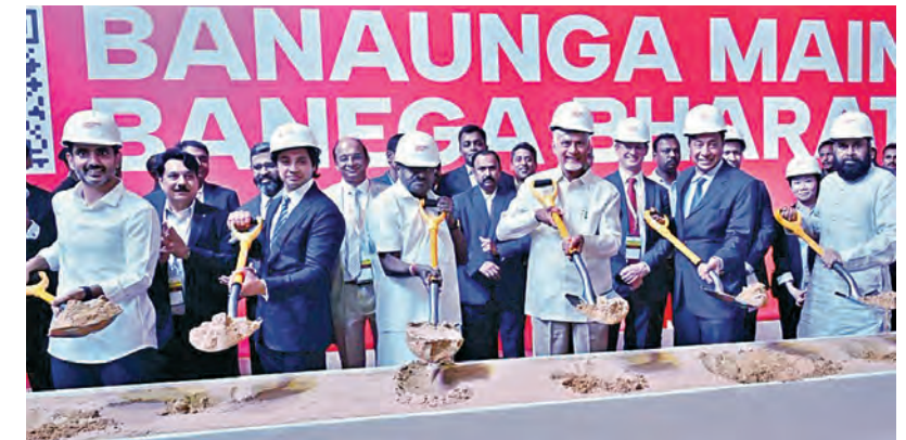
సోమవారం అనకాపల్లి జిల్లా నక్కపల్లి ప్రాంతంలో ఉక్కు ఫ్యాక్టరీకి శంకుస్థాపన చేస్తున్న కేంద్రమంత్రి కుమారస్వామి, సిఎం చంద్రబాబు, డి.సిఎం పవన్, మంత్రి లోకేశ్, లక్ష్మీమిట్టల్, అదిత్య మిట్టల్ తదితరులు