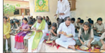
విద్యార్థులతో కలిసి భోజనం చేస్తున్న ఎమ్మెల్యే