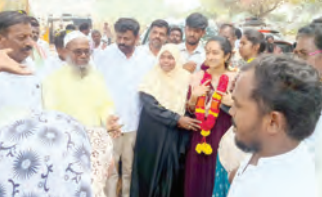
ఎమ్మెల్యే పల్లె సింధూరెడ్డికి స్వాగతం పలుకుతున్న గ్రామస్థులు