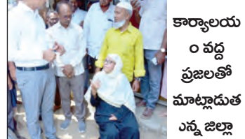
కార్యాలయం వద్ద ప్రజలతో మాట్లాడుతూ ఎంపీ జిల్లా కలెక్టర్