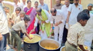
విద్యార్థులకు భోజనం వడ్డిస్తున్న ఎమ్మెల్యే గుమ్మనూరు జయరాం

గుంతకల్లు, మార్చి 24 ప్రభాతవార్త పట్టణంలోని రాజేంద్రప్రసాద్ పురపాలక ఉన్నత పాఠశాలను ఎమ్మెల్యే గుమ్మనూరు జయరాం మంగళవారం ఆకస్మిక తనిఖీ చేశారు. రాష్ట్ర ప్రభుత్వం ప్రతిష్ఠాత్మకంగా చేపట్టిన డాక్టోరీ సీతమ్మ మధ్యాహ్న భోజన నాణ్యతపై విద్యార్థులకు అడిగి తెలుసుకు న్నారు. ఎమ్మెల్యే మాట్లాడుతూ ముఖ్యమంత్రి చంద్రబాబు నాయు డు, విద్యాశాఖ మంత్రి నారా లోకేశ్ విద్యార్థులకు ఉన్నత ప్రమాణాలతో విద్యను అందించేందుకు కృషి చేస్తున్నారని కొనియా డారు. అలాగే స్కూల్ కిటీను అందించి విద్యార్థులను ప్రోత్సహిం ప్నారని పేర్కొన్నారు. విద్యార్థులకు ఉన్నత లక్ష్యాలు నిర్దేశించు కునేలా ఉపాధ్యాయులు బోధన అందించాలన్నారు. ప్రతి విద్యార్థి భాగా వదిలి తల్లిదండ్రులు, ఉపాధ్యాయులకు మంచి పేరు తీసుకురావాలని కోరా రు. అనంతరం విద్యార్థులతో కలిసి ఆయన భోజనం చేశారు. ఈ కార్యక్ర మంలో ఎమ్మెల్యే గోపరదం, మండల ఇన్‌చార్జ్ గుమ్మనూరు నారాయణ