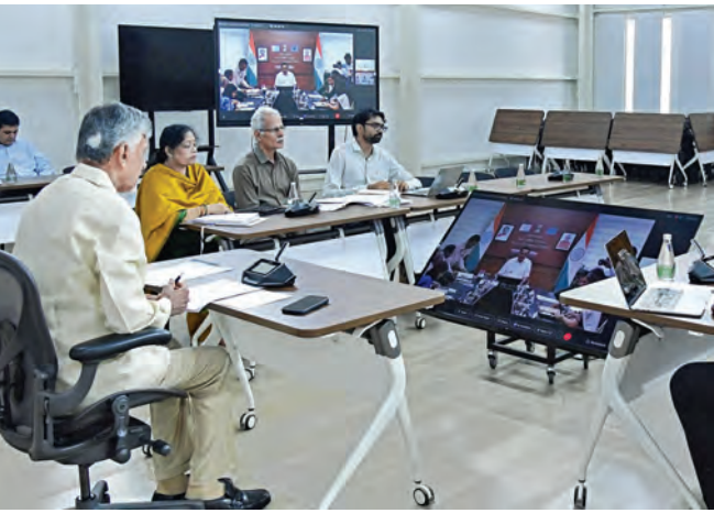
మంగళవారం న్యూఢిల్లీలో జిల్లా జీవన్ మిషన్ 2.0 కేంద్రం, రాష్ట్ర ప్రభుత్వాల మధ్య కుదిరిన ఎంఐయూ కార్యక్రమంలో వర్చువల్ గా పాల్గొన్న ముఖ్యమంత్రి చంద్రబాబు

విజయవాడ, మార్చి 24 ప్రభాతవార్త ప్రతినిధి: హార్ షర్ జల్ కార్యక్రమంలో భాగంగా ప్రతి పట్టణం, ప్రతి ఇంటికీ సురక్షిత తాగునీటిని నిరంతరాయంగా అందించే లక్ష్యంతో పనిచేస్తున్నట్లు ముఖ్యమంత్రి నారా చంద్రబాబు నాయుడు స్పష్టం చేశారు. జిల్లా జీవన్ మిషన్ 2.0 కింద 2028 నాటికి రాష్ట్రంలోని ప్రతి ఇంటికీ తాగునీటి కుళాయి లక్ష్యాన్ని సాధించే ప్రయత్నం ఆయన వెల్లడించారు. మంగళవారం జిల్లా జీవన్ మిషన్ 2.0 కేంద్రం, రాష్ట్ర ప్రభుత్వాల మధ్య ఢిల్లీలో కుదిరిన ఎంఐయూ కార్యక్రమంలో ముఖ్యమంత్రి చంద్రబాబు క్యాంప్ కార్యాలయం నుంచి వర్చువల్ గా పాల్గొన్నారు. గ్రామీణ తాగునీటి సరఫరా వ్యవస్థ ఆపరేషన్, మెయింటెనెన్స్ కు రాష్ట్ర ప్రభుత్వం అత్యధిక ప్రాధాన్యత ఇస్తోందని సీఎం పేర్కొన్నారు. దీనికి సంబంధించి 2025 సెప్టెంబర్ లోనే సమగ్ర విధానాన్ని ప్రకటించినట్లు గుర్తు చేశారు. తాగునీటి సరఫరా వ్యవస్థల నిర్వహణ బాధ్యతను వంచాయతీలకు అప్పగించామని చెప్పారు. ఉప ముఖ్యమంత్రి పవన్ కళ్యాణ్ జిల్లా జీవన్ మిషన్ అమలు విషయంలో ప్రత్యేక శ్రద్ధ మాసిస్తున్నారని అన్నారు. జిల్లా జీవన్ మిషన్ 2028 వరకు కొనసాగిస్తూ కేంద్ర కేబినెట్ తీసుకున్న నిర్ణయంపై ప్రధాని నరేంద్ర మోడీకి ముఖ్యమంత్రి ప్రత్యేక కృతజ్ఞతలు తెలిపారు. పోలవరం ప్రాజెక్టును గోదావరి పుష్కరాల నాటికి పూర్తి చేయాలని లక్ష్యంగా పెట్టుకున్నామని, దీనికి కేంద్రం సహకారంవలన ఈ సందర్భంగా సీఆర్ పోలవరం సీఎం కోలాం, అందుకు ఆయన సుముఖతను వ్యక్తం చేశారు. వర్చువల్ కార్యక్రమంలో సీఎం చంద్రబాబు తన ప్రసంగాన్ని కొనసాగిస్తూ జిల్లా >>2