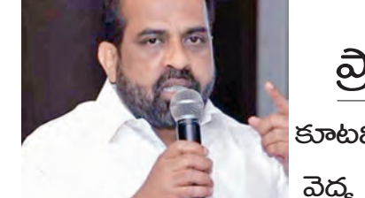
ఆయుష్ కేంద్రాల నూతన భవన నిర్మాణాలు మరెంతో అభినీకీకరణ పనులకు ఆయుష్ శాఖ నిధులు మంజూరు చేసింది. కొన్ని ఆయుష్ ఆరోగ్య కేంద్రాలు శిథిలావస్థకు చేరుకోగా, మరి కొన్ని అలకొర సౌకర్యాలతో ఇరుకు గదుల్లో కొనసాగుతున్నాయి. ప్రాచీన వైద్య విధానాన్ని వైసిపి ప్రభుత్వం పూర్తి నిర్వహణ చేయడంతో ఈ దుస్థితి నెలకొంది. కులూమి ప్రభుత్వం చొరవ తీసుకోవడంతో రాష్ట్రంలోని గ్రామీణ, పట్టణ ప్రాంతాల్లో ఉన్న ఆయుష్ వైద్యశాలల రూపురేఖలు మారనున్నాయి. ఏపీ >>2

విజయవాడ, మార్చి 24 ప్రభాతవార్త ప్రతినిధి: రాష్ట్రంలో పూర్తి నిర్మాణానికి గురైన భారతీయ ప్రాచీన వైద్య సేవల్ని ప్రజలకు చేరువ చేసేందుకు కులూమి ప్రభుత్వం కృషి చేస్తోందని వైద్యారోగ్య శాఖ మంత్రి సత్యకుమార్ యాదవ్ వెల్లడించారు. ఈ మేరకు ఆయన కార్యాలయం విడుదల చేసిన ప్రకటనలో అందులో భాగంగానే 150 ఆయుష్ ఆరోగ్య కేంద్రాల నిర్మాణ పనులు ప్రారంభించామని వివరించారు. రూ. 44 కోట్లతో చేపట్టే ఈ భవన నిర్మాణాలు, ఆధునీకీకరణ పనులు వివిధ దశల్లో ఉన్నాయని తెలిపారు. రెండు నెలల్లోగా పూర్తి చేసే ప్రారంభిస్తున్న రెండు ఆయుష్ కేంద్రాల నిర్మాణం (అయ్యప్పవరం, యోగా, యునాని, సిద్ధ, హోమియోపతి) చరిత్రలో ముందెన్నడూ లేని విధంగా ఒకేసారి భారత్ ఎత్తైన మోడీకి సమర్పించాలని అభివృద్ధి కులూమి ప్రభుత్వం ఉపక్రమించింది. నేషనల్ ఆయుష్ మిషన్ (ఎఐఐ) 2025-26 వార్షిక ప్రణాళికలో భాగంగా మొత్తం 150 >>2