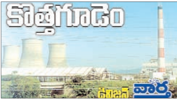
చుంచుపల్లి, జూలూరుపాడు, సుజాతనగర్

పెరిగాయని ఈ సంఘటనలు స్పష్టంగా తెలియజేస్తున్నాయని డి.సి.హెచ్.ఎస్ డాక్టర్ రవి బాబు తెలిపారు. అన్ని ఆసుపత్రుల్లో 24 గంటల వైద్య సేవలు, ఉచిత రక్త పరీక్షలు, టీఫా స్కానింగ్, ఏసీ వార్డులు, పరిశుభ్రమైన వాతావరణం, అత్యాధునిక ఆపరేషన్ థియేటర్లు, రోగులకు అనుకూల సౌకర్యాలు, సదుపాయాలు అందుబాటులో ఉండటం వల్ల స్థానికంగానే చికిత్స పొందేలా ఆసుపత్రి ఉద్యోగుల్లో నమ్మకం పెరుగుతోందన్నారు. దూర ప్రాంతాలకు వెళ్లాల్సిన అవసరం లేకుండా కుటుంబ సభ్యులకు అన్ని రకాలుగా సౌకర్యంగా ఉండటంతో ఉద్యోగులు కూడా తాము పనిచేస్తున్న ఆసుపత్రులకే ప్రాధాన్యం ఇస్తున్నట్లు సిబ్బంది పేర్కొన్నారు. ఉచిత చికిత్స కి కార్పొరేట్ ఆసుపత్రులలో అవకాశాలు ఉన్నప్పటికీ ఉద్యోగులు తాము పనిచేస్తున్న ఆసుపత్రుల్లో చికిత్స పొందుతున్న వైనం ఇటీవల ఏజెన్సీ ప్రాంతాల్లో మెరుగైన నాణ్యమైన ఆధునిక వైద్య సేవలకు నిదర్శనం గా చెప్పవచ్చు.