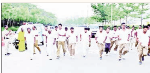
యాదగిరిగుట్ట మార్చి 24 ప్రభాతవార్త