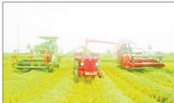
మునగాల, మార్చి 24, ప్రభాతవార్త :

మునగాల మండల కేంద్రంలో రబీ వరి కోతలు ముమ్మరంగా ప్రారంభమయ్యాయి. రబీ సీజన్లో నేటి వరకు బీడపీడలు తెగుళ్ళ కు పిచికారి చేసిన రైతులు దిగుబడి విషయాని కొస్తే భారీగా పెరిగినట్లు తెలుస్తుంది. సుమారు 40 నుండి 50 బస్తాల దిగుబడి వస్తున్నట్లు రైతులు తెలుపుతున్నారు. పెట్టిన పెట్టుబడులకు కొలు చేస్తున్న రైతులకు కొంతమేరకు మిగులుతాయని ఆశాభావం వ్యక్తం చేస్తున్నారు. దీని తోడు రేటు అనుకూలంగా ఉన్నట్లు తెలిపారు. కోతల సమయంలో వాతావరణం అనుకూలించాలని రైతులు వాతావరణ వైపు వాతావరణ సూచనలను అనుసరించడం జరుగుతుంది. తీరా పంట కోసే సమయంలో వాతావరణం లో మార్పులు కలగడం రైతుల గుండెల్లో గుబెలు పుట్టిస్తున్నాయి. ధాన్యం ధరలు తగ్గకుండా ఉండాలని పలు రైతులు కోరుకుంటున్నారు.