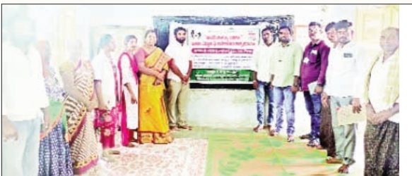
పెద్దపూర మార్చి 24 ప్రభాతవార్త