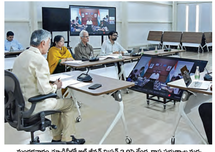
మంగళవారం న్యూఢిల్లీలో జిల్లా జీవన్ మిషన్ 2.0 కేంద్రం, రాష్ట్ర ప్రభుత్వాల మధ్య కుదిరిన ఎంఐయూ కార్యక్రమంలో వర్చువల్ గా పాల్గొన్న ముఖ్యమంత్రి చంద్రబాబు

హార్ షర్ జల్ కార్యక్రమంలో భాగంగా ప్రతి పట్టణం, ప్రతి ఇంటికీ పరిశుభ్రతలను డ్యూరా సభ్యులకు నీటి నాణ్యత పరీక్ష బాధ్యత కేంద్రం, రాష్ట్ర ప్రభుత్వం మధ్య కుదిరిన ఎంఐయూ, కార్యక్రమంలో వర్చువల్ గా పాల్గొన్న సీఎం చంద్రబాబు