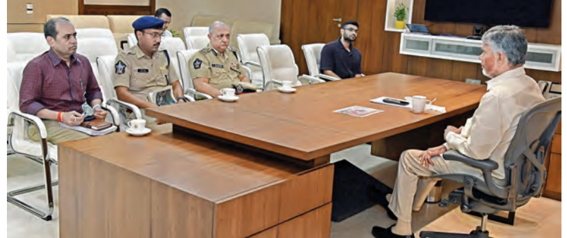
మంగళవారం డిజిపి సహా పోలీసు ఉన్నతాధికారులతో సమావేశమైన సీఎం చంద్రబాబు

విద్యుత్ సంస్థల రుణాలు తీరేలా ప్రణాళిక ఆవిష్కరణల కోసం ఇంక్యుబేషన్ ఫండ్: సీఎం చంద్రబాబు విజయవాడ, మార్చి 24 ప్రభాతవార్త ప్రతినిధి: విద్యుత్ కొనుగోలు ఛార్జీలను తగ్గించే ఆంశంపై అధికారులు పూర్తి స్థాయిలో దృష్టి పెట్టాలని ముఖ్యమంత్రి చంద్రబాబు నాయుడు ఆదేశించారు. ఇప్పటికే ఈ దిశగా చేపడుతున్న చర్చలను మరింత ముమ్మరం చేయాలన్నారు. ప్రభుత్వం చేపట్టే విద్యుత్ కొనుగోలు ధరను యూనిట్ కు రూ. 4 కు తగ్గించడంతో పాటు ప్రజలపై భారం వేయకుండా విద్యుత్ సంస్థల రుణాల తీర్చిదిద్దుకు కార్యాచరణ చేపట్టాలని సూచించారు. ఈ మేరకు మంగళవారం సచివాలయంలో జరిగిన విద్యుత్ శాఖ సమీక్షలో సీఎం కీలక సూచనలు చేశారు. 2028-29 నాటికి విద్యుత్ కొనుగోలు ఛార్జీలను తగ్గించేందుకు చేపట్టిన ప్రణాళికలను విద్యుత్ శాఖ అధికారులు సీఎం చంద్రబాబు ముందుంచారు. విద్యుత్ రంగంలోని వివిధ విభాగాల ద్వారా సంస్కరణలు చేపడితే మొత్తంగా యూనిట్ కు రూ. 1.32 చొప్పున విద్యుత్ కొనుగోలు భారాన్ని తగ్గించవచ్చని సీఎంకు వివరించారు. 2028-29 నాటికి యూనిట్ కొనుగోలు ధరను రూ. 4.10 కు తగ్గేలా చర్చలు తీసుకుంటున్నట్లు అధికారులు వివరించారు. రూ. 4 కు ఈ కొనుగోలు ధరను తగ్గించేలా చూడాలని సీఎం ఆదేశించారు. నూతన టెక్నాలజీని, ఇన్ఫ్రాస్ట్రక్చర్ను వినియోగం చేసుకుని విద్యుత్ పొందుపు చర్చలు చేపట్టాలని సీఎం సూచించారు. విద్యుత్ సంస్థల సమగ్ర నిర్వహణతో 2025-26 ఆర్థిక సంవత్సరానికి సుమారు రూ. 339 కోట్ల మేర ఆదా చేశామని, ఈ తరహా పొందుపు చర్చలను మరింతగా తీసుకోవాలని అధికారులకు ముఖ్యమంత్రి >>2