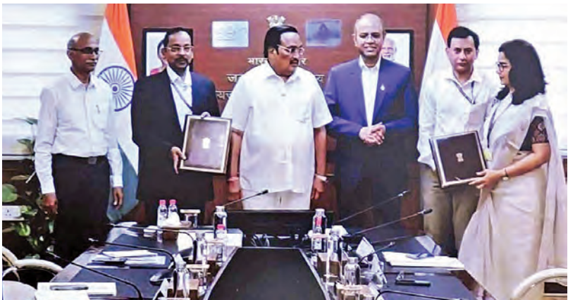
మంగళవారం న్యూఢిల్లీలో కేంద్రమంత్రి పాటిల్ సమక్షంలో జేజీఎం 2.0 పై కేంద్ర ప్రభుత్వంతో రాష్ట్ర ప్రభుత్వం తయారు అధికారులు ఒప్పందం చేసుకుంటున్న దృశ్యం

విజయవాడ మార్చి 24 ప్రభాతపార్లమెంటు: పార్లమెంట్ లో వైసిపి మొదటి అంతస్తులోని 11 వ నెంబర్ రూమ్ కి అంతస్తు కేటాయింపు. దీనిపై పార్టీ ఎంపీలు తీవ్ర అసంతృప్తి వ్యక్తం చేశారు. రూమ్ వెంటనే మార్చాలని స్పీకర్ ను కలిసి విజ్ఞప్తి చేశారు. వారి విజ్ఞప్తి మేరకు స్పీకర్ 12 వ రూమ్ కేటాయించారు. గత అనెంబ్లీ ఎన్ కౌంటర్ల వైశాఖ కేవలం 11 స్పీట్లు