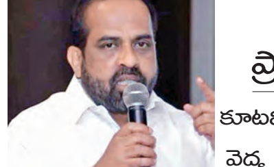
ఆయుష్ కేంద్రాల నూతన భవన నిర్మాణాలు నిధులు మంజూరు చేసింది. కొన్ని ఆయుష్ ఆరోగ్య కేంద్రాలు శిథిలావస్థకు చేరుకోగా, మరి కొన్ని అలకొర సౌకర్యాలతో ఇరుకు గదుల్లో కొనసాగుతున్నాయి. ప్రాచీన వైద్య విధానాన్ని వైసిపి ప్రభుత్వం పూర్తిగా నిర్వహించేందుకు ఈ దృష్టి నెలకొంది. కుటమి ప్రభుత్వం చొరవ తీసుకోవడంతో రాష్ట్రంలోని గ్రామీణ, పట్టణ ప్రాంతాల్లో ఉన్న ఆయుష్ వైద్యశాలల రూపురేఖలు మారనున్నాయి. ఏపీ

విజయవాడ, మార్చి 24 ప్రభాతవార్త ప్రతినిధి: రాష్ట్రంలో పూర్తిగా నిర్వహణలోకి రెండు భారతీయ ప్రాచీన వైద్య సేవల్ని ప్రజలకు చేరువ చేసేందుకు కుటమి ప్రభుత్వం కృషి చేస్తోందని వైద్యారోగ్య శాఖ మంత్రి సత్యకుమార్ యాదవ్ వెల్లడించారు. ఈ మేరకు ఆయన కార్యాలయం విడుదల చేసిన ప్రకటనలో అందులో భాగంగానే 150 ఆయుష్ ఆరోగ్య కేంద్రాల నిర్మాణ పనులు ప్రారంభించామని వివరించారు. రూ. 44 కోట్లతో చేపట్టే ఈ భవన నిర్మాణాలు, ఆధునీకీకరణ పనులు వివిధ దశల్లో ఉన్నాయని తెలిపారు. రెండు నెలల్లోగా పూర్తి చేసే ప్రారంభిస్తున్న రెండు ఆయుష్ కేంద్రాల నిర్మాణం (అయ్యప్పవరం, యోగా, యునాని, సిద్ధ, హోమియోపతి) చరిత్రలో ముందెన్నడూ లేని విధంగా ఒకేసారి భారత్ ఎత్తైన మోతాక సదుపాయాల అభివృద్ధికి కుటమి ప్రభుత్వం ఉపక్రమించింది. నేషనల్ ఆయుష్ మిషన్ (ఎఐఐ) 2025-26 వార్షిక ప్రణాళికలో భాగంగా మొత్తం 150