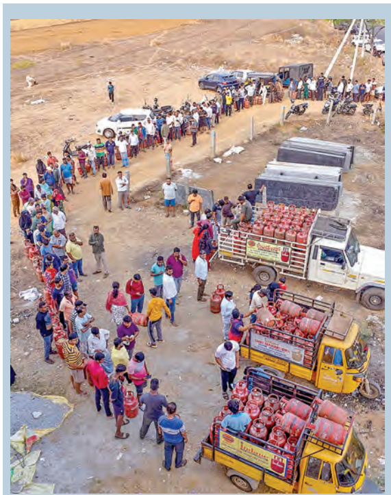
మంగళవారం చిక్కమగళూరులో గ్యాస్ కోసం వారులు తీరిన ప్రజలు