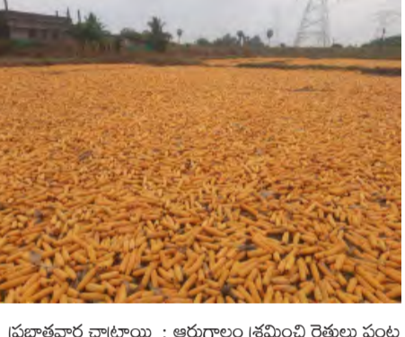
ప్రభాతవార్త చాట్రాయి : ఆరుగాలం క్రమించి రైతులు పంట

పండిస్తే ధర నిర్ణయించేది దళాలు అనటంలో సందేహం లేదు. రైతు ఏ పంట పండించిన ప్రభుత్వం మద్దతు ధరలు ప్రకటించిన దళాలను నిర్ణయించిన ధరకే కొనుగోలు చేయాలి అనుమతిగా వస్తోంది. రబీ సీజన్ లో చాట్రాయి మండలంలో 12 వేల ఎకరాలలో మొక్కజొన్న సాగు చేస్తున్నట్లు వ్యవసాయ శాఖ గణాంకాలు తెలియజేస్తున్నాయి. మొక్కజొన్న పంట చేతికి వస్తుండగా ప్రభుత్వం క్వింటాలకు 2400 రూపాయలు మద్దతు ధర ప్రకటించగా దళాలు రైతులు వద్ద కేవలం 1600 రూపాయలకే కొనుగోలు చేసేందుకు ముందుకు వస్తున్నారు. దీంతో రైతులు పండించిన పంటకు సరైన ధర రాక సస్పెన్షన్లు వస్తున్నాయని నువ్వు రావేదన వ్యక్తం చేస్తున్నారు. గత ఏడాది మార్చి ఫెడ్ ద్వారా