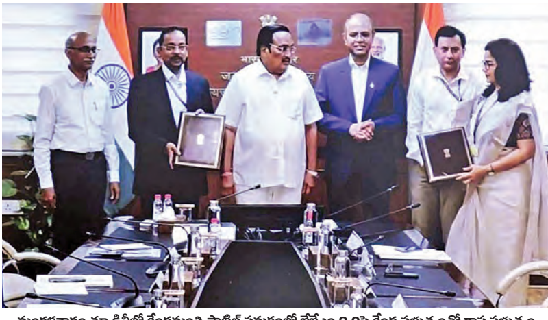
మంగళవారం న్యూఢిల్లీలో కేంద్రమంత్రి పాటిల్ సమక్షంలో జేజీఎం 2.0 పై కేంద్ర ప్రభుత్వంతో రాష్ట్ర ప్రభుత్వం తయారు అధికారులు ఒప్పందం చేసుకుంటున్న దృశ్యం

విజయవాడ మార్చి 24 ప్రభాతపార్లమెంటు: పార్లమెంట్ లో వైసిపికి మొదటి అంతస్తులోని 11 వ నెంబర్ రూమ్ ను స్పీకర్ అంటిచ్చా రేలా అయింది. దీనిపై పార్టీ ఎంపీలు తీవ్ర ఆసం తృప్తి వ్యక్తం చేశారు. రూమ్ వెంటనే మార్చాలని స్పీకర్ ను కలిసి విజ్ఞప్తి చేశారు. వారి విజ్ఞప్తి మేరకు స్పీకర్ 12 వ రూమ్ కేటాయించారు. గత అనెంబ్లీ ఎన్ కౌంటర్ల వైవాళి కేవలం 11 స్పీట్లు