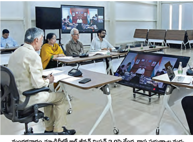
మంగళవారం న్యూఢిల్లీలో జిల్లీ జీవన్ మిషన్ 2.0 కేంద్ర, రాష్ట్ర ప్రభుత్వాల మధ్య కుదిరిన ఎంఐయం కార్యక్రమంలో వర్చువల్ గా పాల్గొన్న ముఖ్యమంత్రి చంద్రబాబు

హార్ షర్ జల్ కార్యక్రమంలో భాగంగా ప్రతిపట్టణం, ప్రతి ఇంటికి పరిశుభ్రజలం డ్యూరా సభ్యులకు నీటి నాణ్యత పరీక్ష బాధ్యత కేంద్ర, రాష్ట్ర ప్రభుత్వం మధ్య కుదిరిన ఎంఐయం, కార్యక్రమంలో వర్చువల్ గా పాల్గొన్న సీఎం చంద్రబాబు