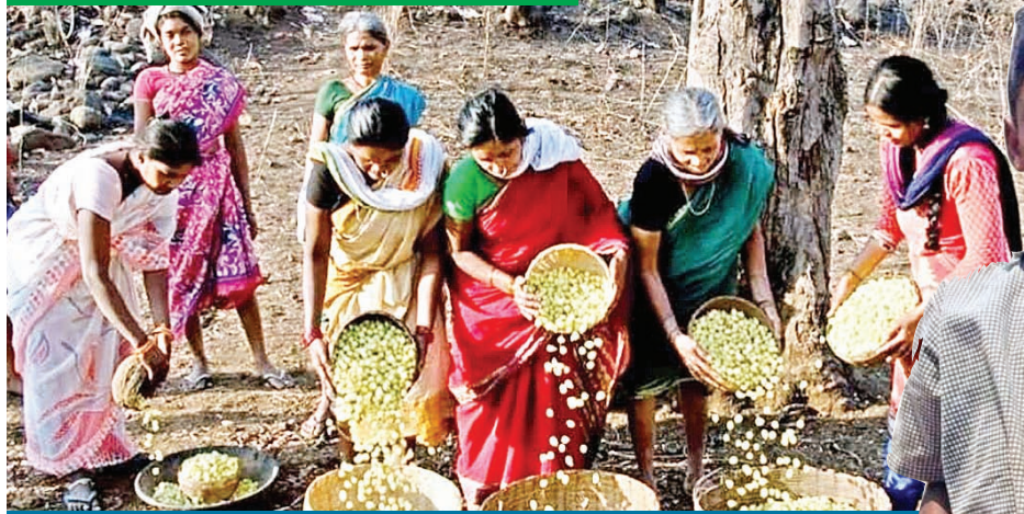
ఆదివాసీల కల్పవృక్షం.. 2లో

జయశంకర్ భూపాలపల్లి జిల్లాలోని కాటారం, మహదేవపూర్, పలిమెల, మహముత్తారం మండలాలతో పాటు ఆయా మండలాలలోని అటవీ గ్రామాల గిరిజనులకు ఇప్ప పువ్వు ప్రధాన ఆదాయ వనరుగా మారింది. ప్రతి ఏటా మార్చి, ఏప్రిల్ నెలల్లో ఇప్ప చెట్లు పూతకు వస్తాయి. ఈ సమయంలో అడవి బిడ్డలు తమ కుటుంబ సభ్యులతో కలిసి తెల్లవారుజామునే అడవి బాట పడుతున్నారు. అంతకముందు గత రెండు రోజుల క్రితం ఇప్పపువ్వు సేకరణకు ముందు ఇప్ప చెట్ల వద్ద గిరిజనులు పసుపు, కుంకుమతో పాటు నైవేద్యాన్ని సమర్పించి వేడుకున్నారు. ఇప్ప పువ్వు సేకరణకు వెళ్లేటప్పుడు ఎవరికీ కూడా ఎలాంటి ఆపద రావద్దని అందరూ సంతోషంగా ఉండాలని ప్రకృతి పరంగా తమ సాంప్రదాయపరంగా ఉదయాన్నే తలంటు స్నానం ఆచరించి ఎంతో నియమ నిష్ఠలతో పూజలు నిర్వహించి ప్రతి ఏటా మాదిరిగానే తమ మొక్కలను సమర్పించుకున్నారు.