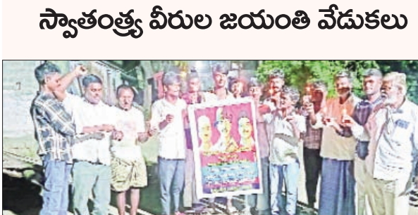
చెన్నారావుపేట, మార్చి 24