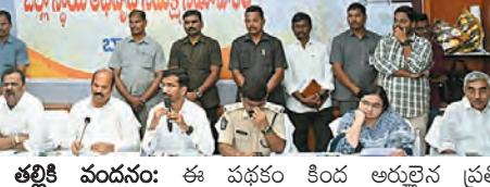
తల్లికి వందనం: ఈ పథకం కింద అర్హులైన ప్రతి విద్యార్థికి నగదు అందేలా చూడాలన్నారు.