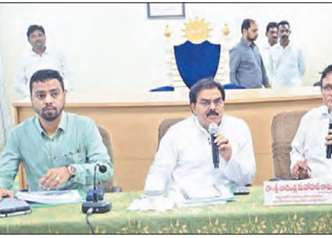
అయన, త్వరలో అధికారులతో ప్రత్యేక సమావేశం నిర్వహించి అభివృద్ధి అంశాలపై సమగ్ర చర్చ జరుపుతామని చెప్పారు. అధికారులు నిర్దిష్ట లక్ష్యాల్లో గడువులోగా పనులు పూర్తి చేయాలని సూచించారు.

తెనాలి మున్సిపాలిటీ, మార్చి24,(ప్రభాతవార్త): తెనాలి పట్టణానికి పూర్వవైభవం తీసుకురావడమే లక్ష్యంగా, అన్ని రంగాల్లో రాష్ట్రంలో అయిదో స్థానంలో నిలిచేలా సమగ్ర చర్యలు చేపట్టాలని రాష్ట్ర పౌరసంబంధాల శాఖ మంత్రి నాదెండ్ల మనోహర్ అధికారులకు ఆదేశించారు.మంగళవారం పట్టణం లోని మున్సిపల్ కార్యాలయంలో జరిగిన సమీక్ష సమావేశంలో మంత్రి పలు కీలక అంశాలపై దృష్టి సారించారు. ముందుగా వస్తుల పనులపై ఆరా తీసి, కనీసం 95 శాతం వసూళ్ల సాధించేలా చర్యలు తీసుకోవాలని సూచించారు. రిజిస్ట్రేషన్ శాఖ నుంచి మున్సిపాలిటీకి రావాల్సిన రూ.9 కోట్ల నిధులను త్వరితగతిన పొందేలా చర్యలు చేపట్టాలన్నారు.బెందర్లు పొంది పనులు ప్రారంభించాలి లేదా అలస్యం చేస్తున్న కాంట్రాక్టర్లకు కఠిన చర్యలు తీసుకోవాలని హెచ్చరించారు. పనులు పూర్తి చేసిన కాంట్రాక్టర్లకు బిల్లులు వెంటనే చెల్లించాలని ఆదేశించారు.పట్టణంలో అసంపూర్ణ ఉన్న భవనాల వివరాలు సేకరించి, వాటి పూర్తి కోసం ప్రణాళిక సిద్ధం చేయాలని చెప్పారు. ఖాళీగా ఉన్న భవనాలను గుర్తించి, ప్రస్తుతం అద్దె భవనాల్లో నడుస్తున్న సచివాలయాలు, శానిటరీ ఇన్స్పెక్టర్ కార్యాలయాలను అక్కడికి మార్చాలని సూచించారు.బిఠానగర్లోని ప్లీజర్ పార్కు అభివృద్ధి పనులను ఏప్రిల్ చివరి నాటికి పూర్తి చేసి, మే నెలలో ప్రజలకు అందుబాటులోకి తీసుకురావాలని మంత్రి ఆదేశించారు. అమరావతి ప్లాట్లోని రెండు పార్కులను కూడా త్వరలో అభివృద్ధి చేయనున్నట్లు ప్రకటించారు.ప్రజా సమన్వయంపై తక్షణ చర్యలు