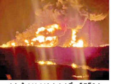
రాయపూడి దగ్గర దృశ్యమవుతున్న కేబుల్ లైన్ ప్రభులు